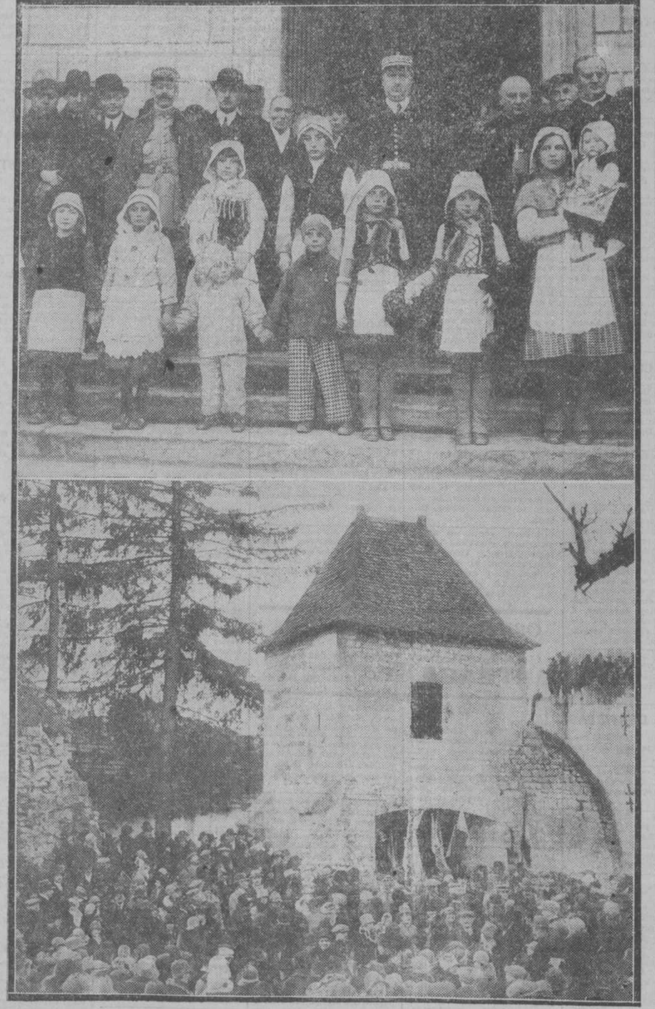
En el entusiasmo nacional francés por el gran acontecimiento conmemorativo no han faltado los niños, esos ingenuos y candorosos niños campesinos, para quienes la historia heroica de la pastorella de Domremy es una vibrante leyenda.