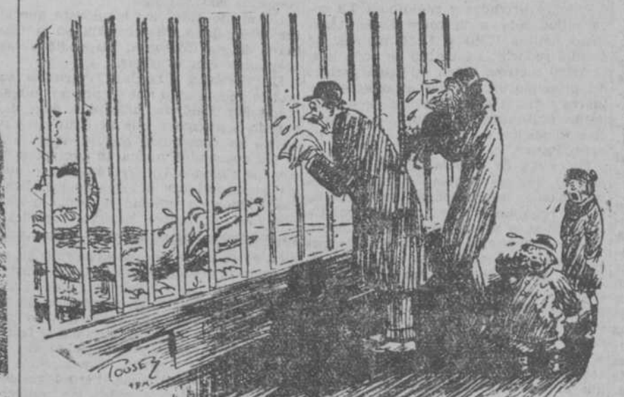
Desgarrador grupo fotográfico de la familia de buen corazón que se conmovió de ver llorar al cocodrilo.