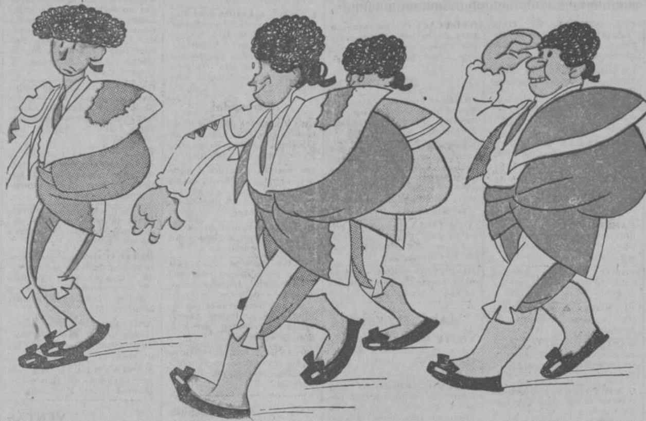
—Chico, ¡cómo aplauden! —Es a mí; el año pasado me hicieron repetir el paseo hasta tres veces.