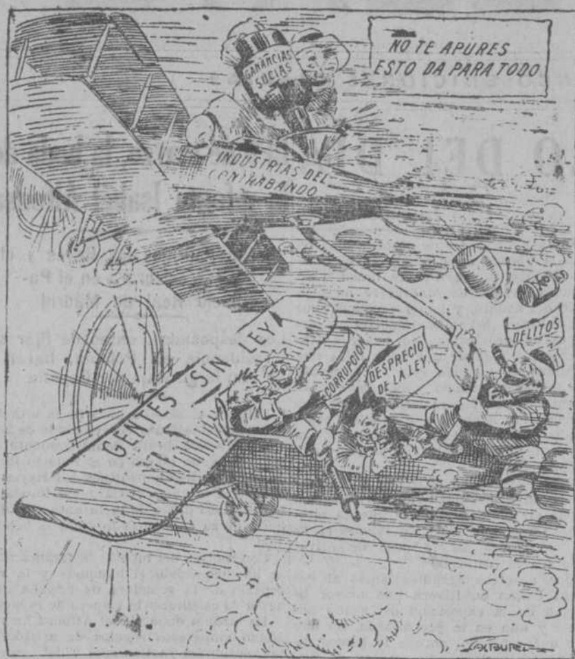
Las Cámaras norteamericanas votan millones para que se cumpla la ley seca ("Washington News")