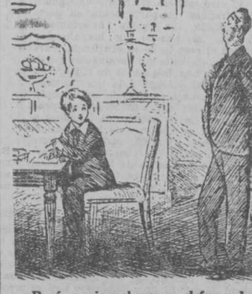
—Papá, ¿quieres hacerme el favor de resolverme este problema? —Lo siento, hijo; pero no puede ser. No estaría bien. —No importa; prueba a ver. ("Punch", Londres.)