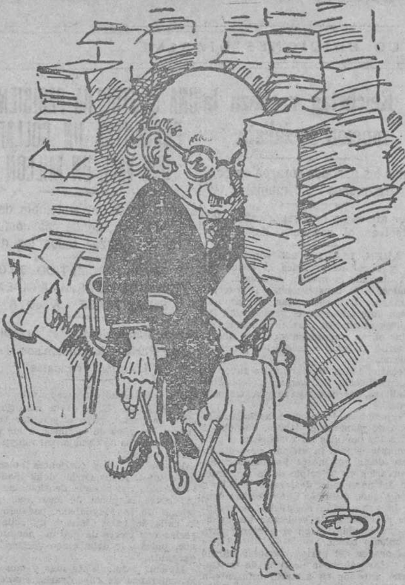
Papá, me he vestido para firmar el pacto contra la guerra ("Nebelspater", Zurich.)