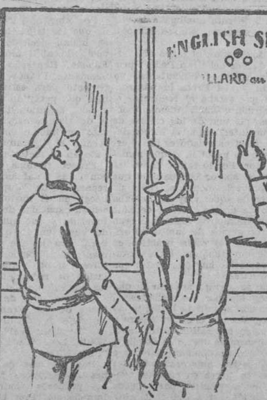
—¿Sabes lo que dice ahí? —¡Qué gracia! Está debajo la traducción: "Billar en el primer piso".