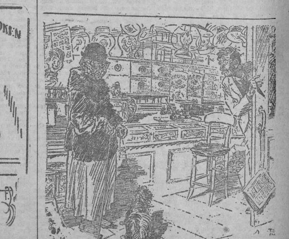
—¿Muerde, señora? —Sí; pero no tema, que no está rabioso.