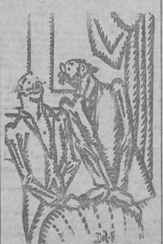
—¡Es enorme ese tenor! Lleva una hora cantando. ¡Magníficos pulmones!