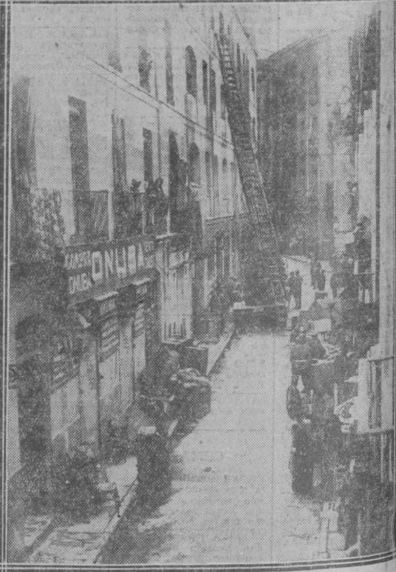
La típica calle de las Velas, en los instantes del salvamento de escombros y muebles de las casas circunvecinas del teatro incendiado

NAUEN, 24.—Dicen de Moscú que en vista de que los hielos han empezado a cubrir de nuevo el mar, se ha dado orden al "Krasin" de que regrese a su base de Leningrado.