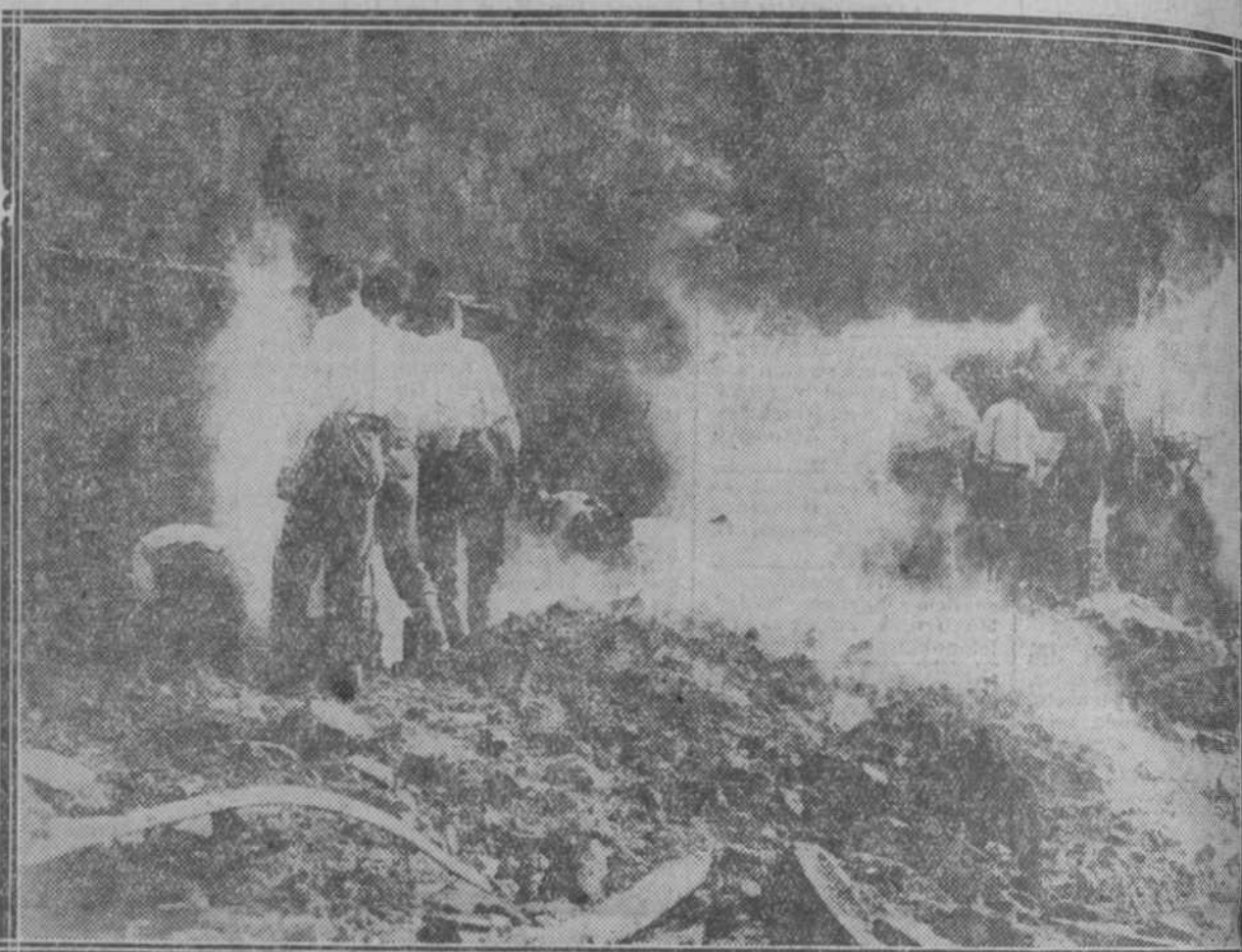
Los bomberos, entre escombros humeantes, prosiguen la búsqueda de cadáveres