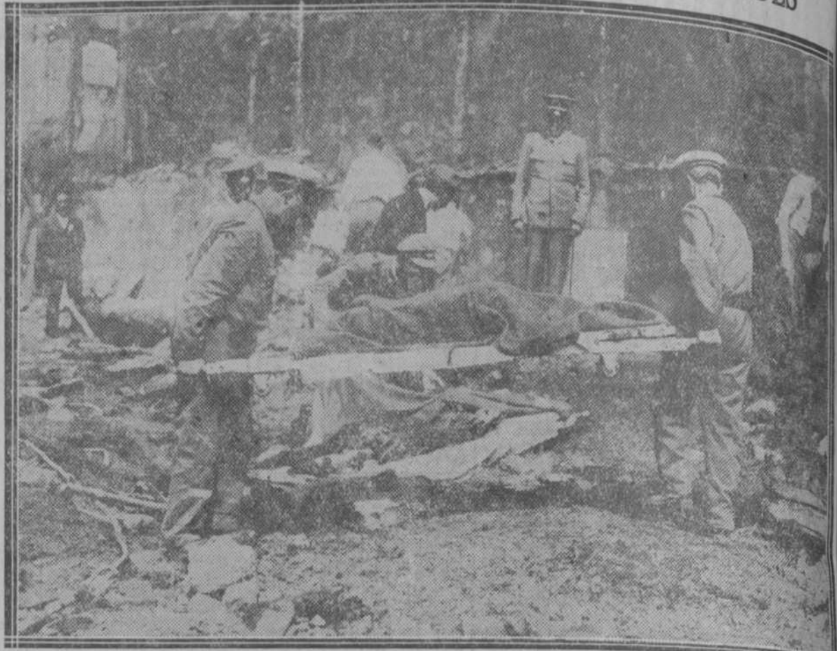
La búsqueda y conducción de cadáveres en el interior del teatro derruido