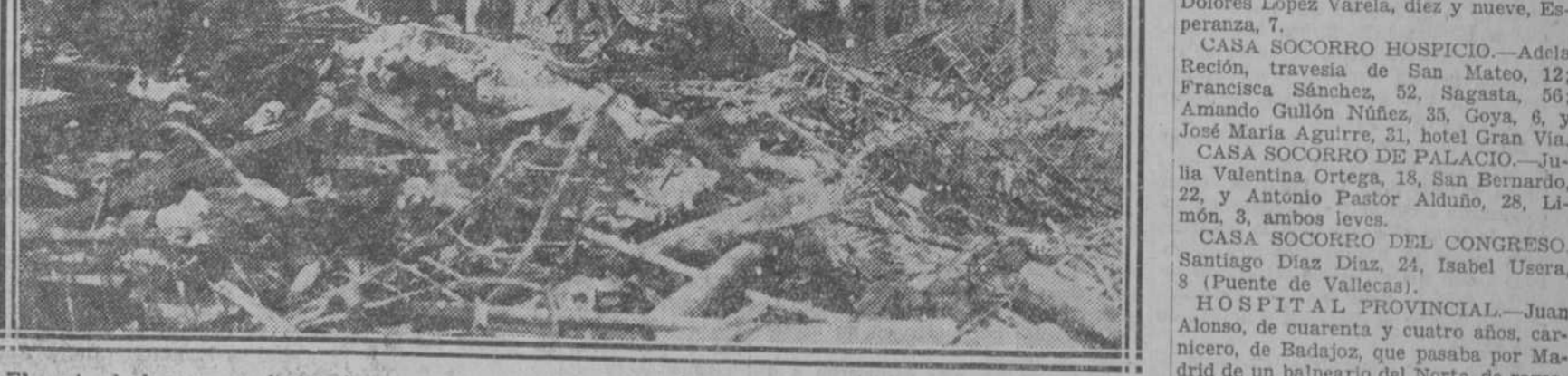
El patio de butacas, reducido a un montón de escombros. En el fondo, la puerta de salida del público. Enfrente, fachada posterior de la casa número 81 de la calle de Toledo, contigua al teatro de Novedades, aludida en nuestra información como punto de mira del incendio.