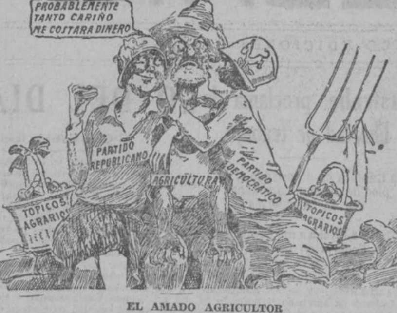
EL AMADO AGRICULTOR ("Dispatch", Columbus.)