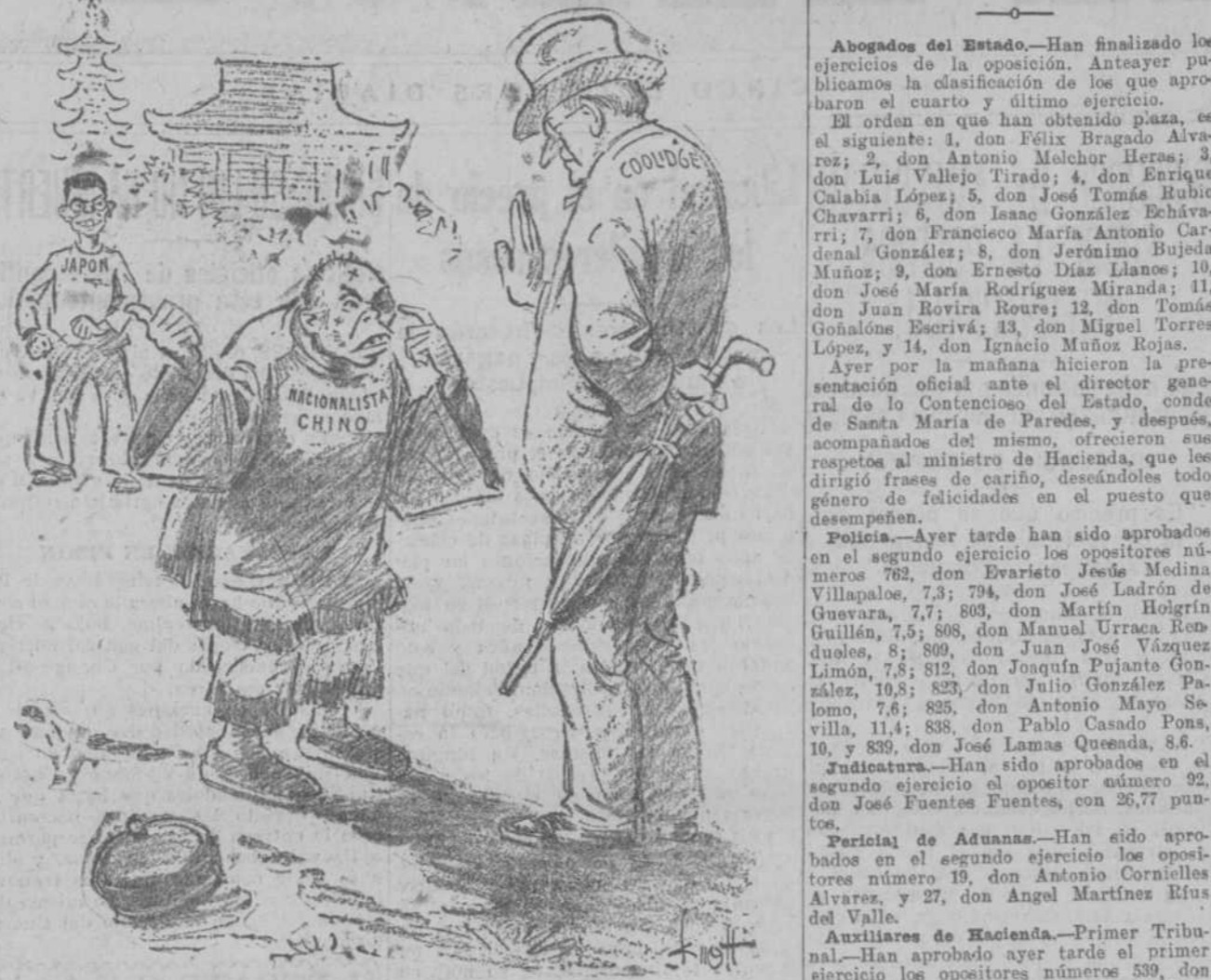
—Mira, tío; ése me ha pegado!