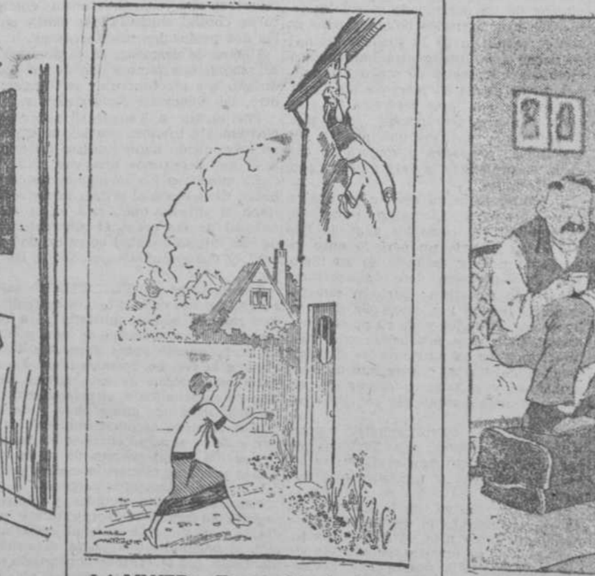
LA MUJER.—Espera ahí colgado un momento mientras yo corto estas flores, no las vayas a chafar. —Papá, hoy habla el periódico de la cadena de oro que regalaste a mamá por su cumpleaños. —¿Sí? ¿Y qué dice? —Que se gratificará a quien la devuelva.