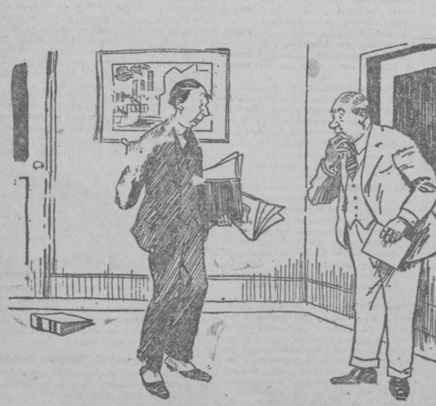
—Ese hombre está furioso. Asaba de decirme que me ahorque... —Sí; cuando se pone de ese modo no hay más remedio que llevarle la corriente.

De venta en todas las farmacias, droguerías, hoteles, depósitos de aguas minerales, restaurantes y coches-camas de todos los trenes.