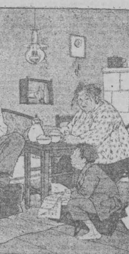
—¿Por qué le has pegado? —Porque es más pequeño.