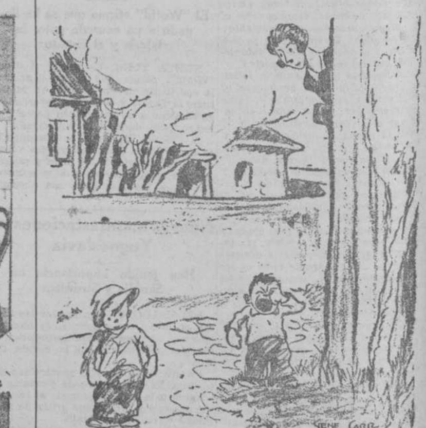
—¿Por qué le has pegado? —Porque es más pequeño.