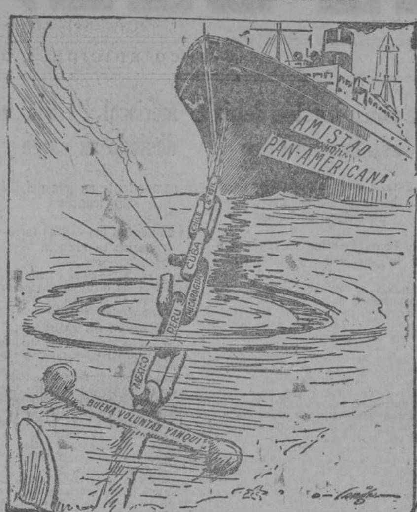
EL ESLABON ROTO (The Philadelphia Star.)