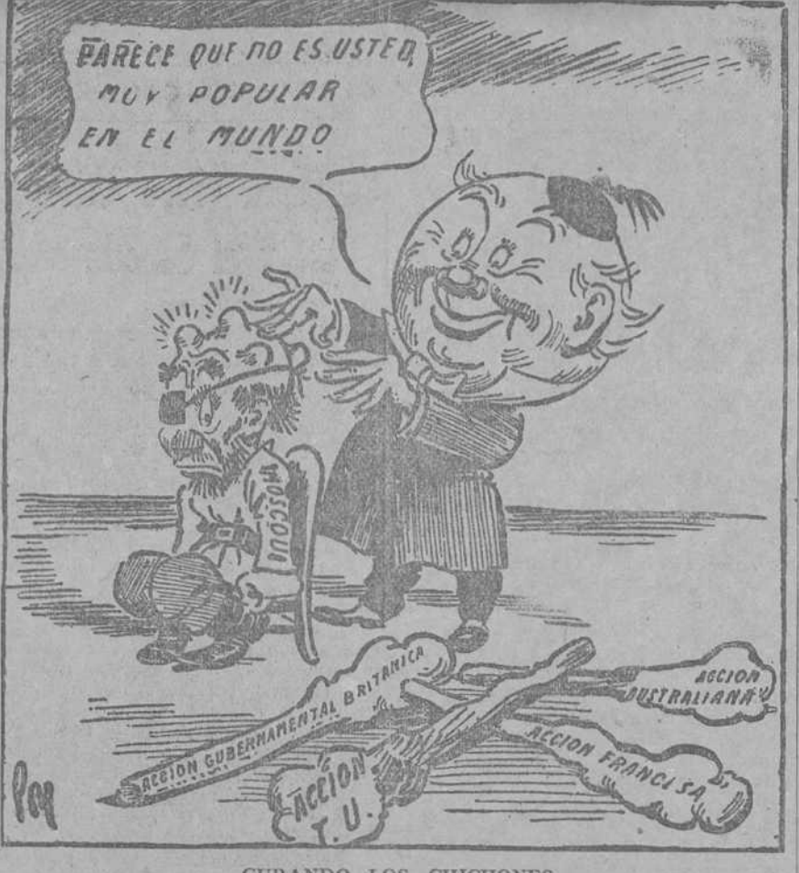
CURANDO LOS GICHONES