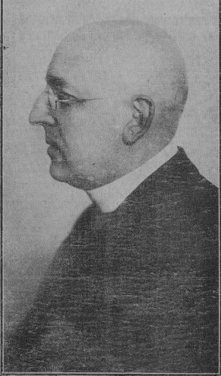
Monseñor Seipel, canceller de Austria.

El doctor Eckener llega a Buenos Aires BUENOS AIRES, 18.—A bordo del «Cap Polonio» llegaron hoy Schroeder y el doctor Eckener, que vienen a realizar las gestiones relativas al establecimiento definitivo de la línea aérea Sevilla-Buenos Aires.