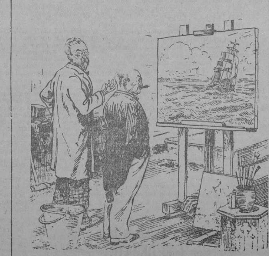
EL ARTISTA (al futuro comprador).—Dé usted un paso atrás y verá mejor el efecto del agua. (London Opinton, Londres.)