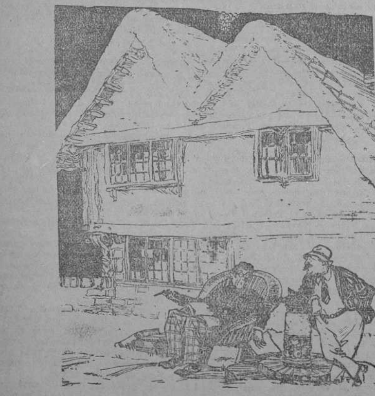
—¿Se quedó el editor con alguna de las cosas que le enviaste? —Sí; con los sellos que incluía para la contestación. (Passin Show, Londres.)