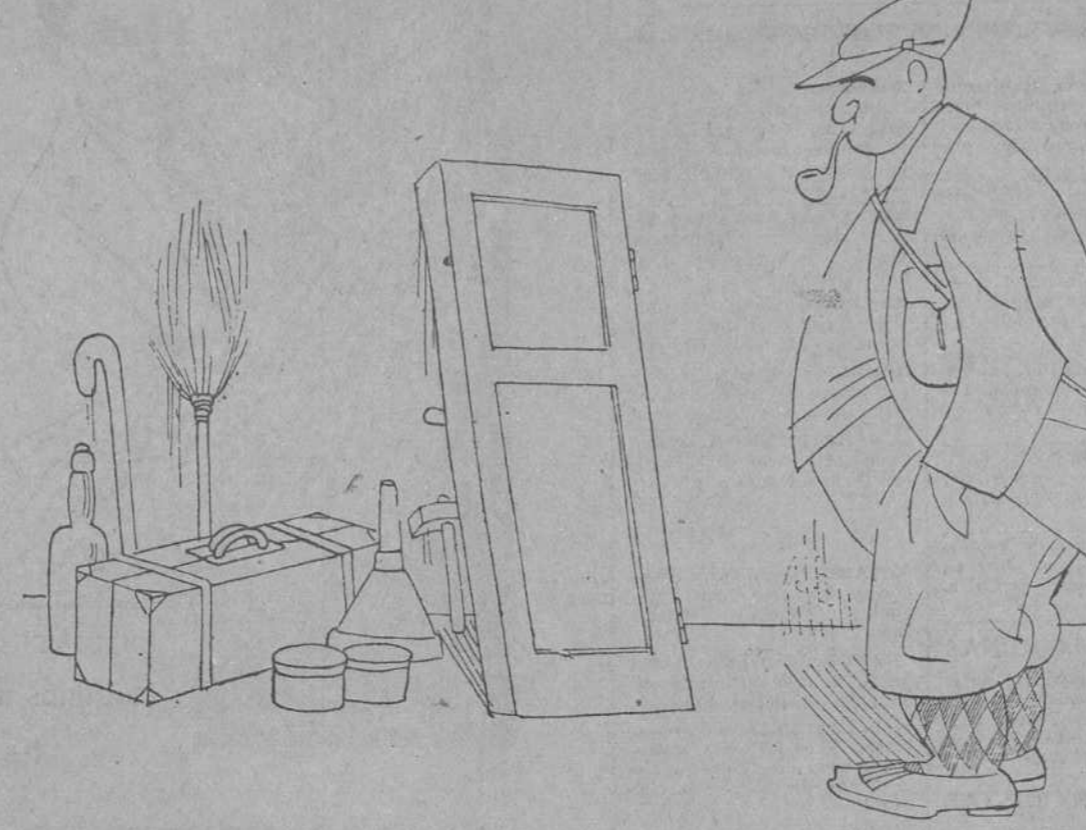
EL MISTER.—¿Y pensar la serie de máquinas y personal que necesitamos en Inglaterra para hacerlos!...