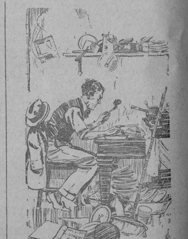
EL ETERNO PROTESTON (que en ausencia de su mujer ha tenido que ocuparse hasta de hacer la comida).—¡Pero se puede saber qué diablos habéis hecho hoy con las patatas!... (Passing Show, Londres.)