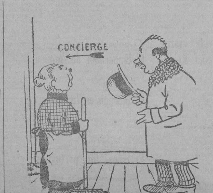
—El ruido de la fábrica... Sólo le molestará los quince primeros días; después se acostumbrará usted. —Bien, pues volveré dentro de quince días. (Dimanche Illustré, Paris.)