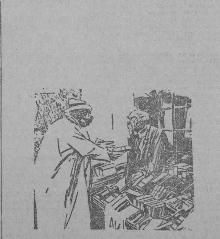
Le devuelvo este ejemplar de "Recetas para todo" porque no trae lo que debe decirle a su mujer un hombre que vuelve tarde a casa. (Passing Show, Londres.)