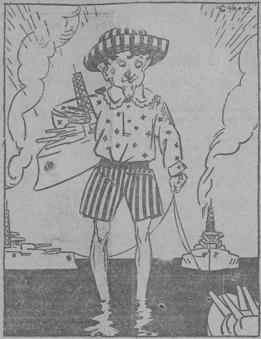
«América no quiere discutir la proposición inglesa para una nueva orientación de los acorazados.» (Evening Times, Glasgow.)