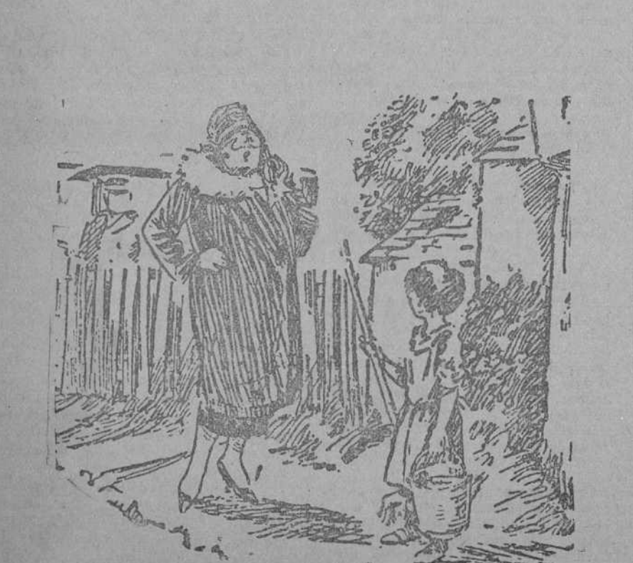
LA SENORA (con tono protector).—Me he enterado que tu mamá está muy enferma. ¿Puedo hacer algo? LA HIJA.—Sí, señora; hay que partir leña, lavar el piso, echar de comer a los pollos y limpiar el chiquero. (The Humorist, de Londres.)

CORONAS DIADEMAS DE AZAHAR FLORES Y PLANTAS RUBIO.—CONCEPCION JERONIMA.