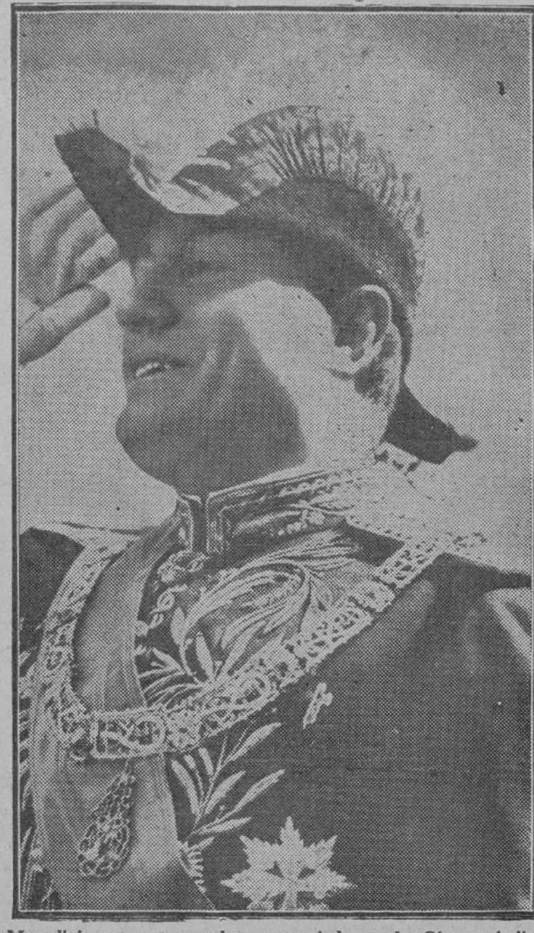
Mussolini, que anteaer ha pronunciado en la Cámara italiana un importantísimo discurso

Podríamos decir que es el discurso mismo la figura de actualidad, porque la poderosa personalidad del duce italiano mantiene siempre viva la atención de la opinión mundial. Mussolini habla con bastante frecuencia ante asambleas populares; pero, más que discursos, pronuncia arengas cortas, secas, vibrantes. Así, un discurso del jefe del fascismo suele ser un acontecimiento, suele señalar un hito en la marcha de la nueva Italia. El último no ha desmentido la tradición, y si no se pueden—y nosotros no podemos—aceptar muchas de sus afirmaciones, es fuerza reconocer que marca una fecha en la historia de la IV Italia.