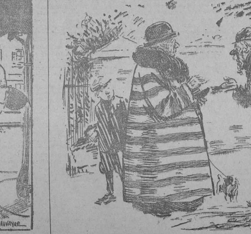
—¿Usted es el pobre que antes pedía al final de esta calle? —Sí, señora. Es que ahora he abierto una sucursal. (Passing Show, Londres.)