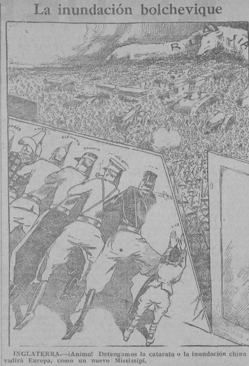
INGLATERRA.—¡Animo! Detengamos la catarata o la inundación china invadirá Europa, como un nuevo Mississippi. (Del 420, Florencia.)