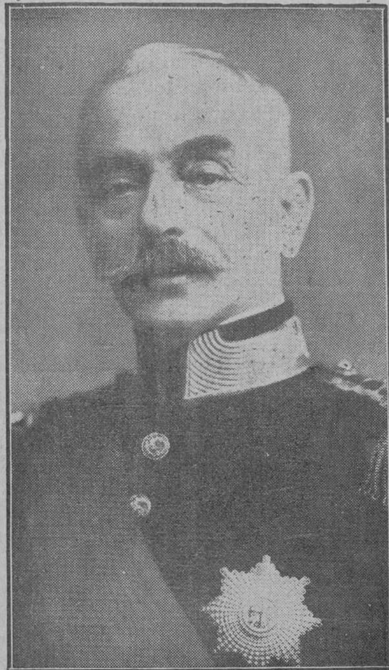
El general Carmona, presidente de la república portuguesa

Hoy hace un año que el general Gomes da Costa, sublevándose al frente del Ejército portugués, de todo el Ejército portugués, inició la obra redentora en la nación vecina. El actual jefe del Estado estuvo desde los primeros momentos al lado de la sublevación, y en el primer Gobierno que se constituyó ocupaba la cartera de Negocios Extranjeros. Cuando las circunstancias obligaron al general Gomes da Costa a dejar el Poder, el general Carmona se puso al frente del movimiento salvador. Hace un año que está en la brecha, y en ese tiempo ha tenido que dominar en más de una ocasión situaciones difíciles que han puesto a prueba su energía, su tacto y su habilidad. El general Carmona es un fiel amigo de España.