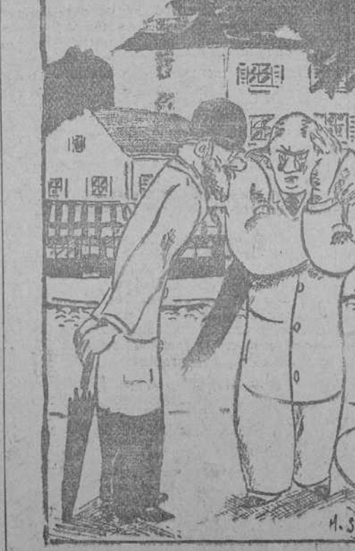
—¡Ah, mi querido amigo! He visto la puerta muy de cerca. —¿Alguna enfermedad? ¿Un accidente? —No; vengo de un entierro. (Erecltor, París.)