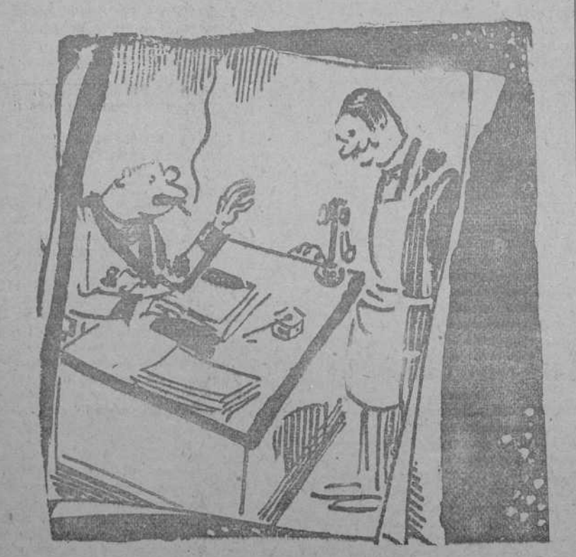
—¡Inútil discutir, Juan; aquí hay un imbécil, tú o yo. —¡Oh! Conozco bien al señor y sé que no tendría un imbécil a su servicio. (Dimanche Illustré, París.)

Quosco de EL DEBATE CALLE DE ALCALA (frente a las Calatravas)