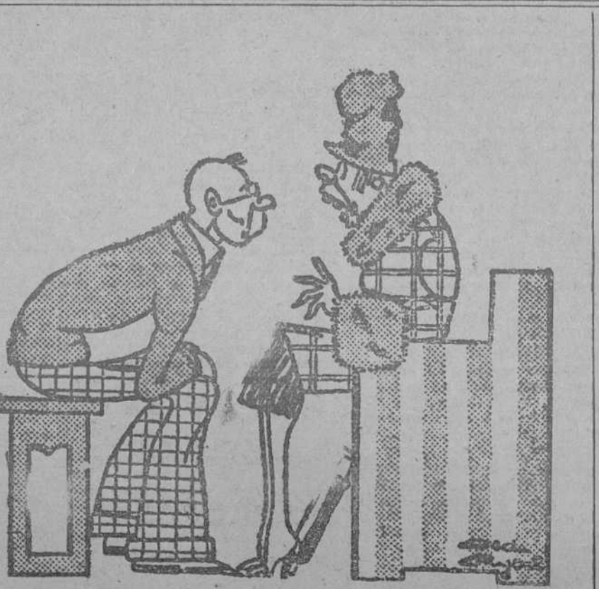
—Doctor, con frecuencia sufro grandes impresiones. —Evite usted mirarse al espejo. (Péle Mèle, París.)