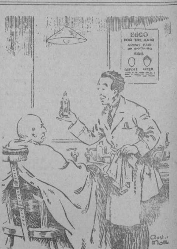
BARBERO.—¿Quiere usted que le ponga esta loción? Es algo sorprendente contra la calvicie. —Gracias. Soy el autor. (Pasting Show, Londres.)