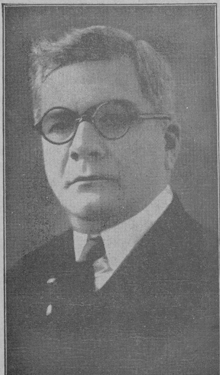
Excelentísimo señor don Gerardo Machado, presidente de la república de Cuba, que ha enviado a España, con destino a los mataderos por los temporales en Marruecos, 60.000 duros...