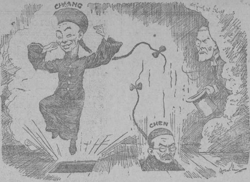
CHIANG.—Yo subo y Chen baja. Chamberlain aquí sin saber qué hacer. (De News of the World, Londres.)

Alude a que Chen, con quien Inglaterra se había comunicado, no es ya sombra de lo que fué, y, en cambio, Chiang sube. Pero quizás de dirigirse Chamberlain a Chiang, el juego sería al revés.