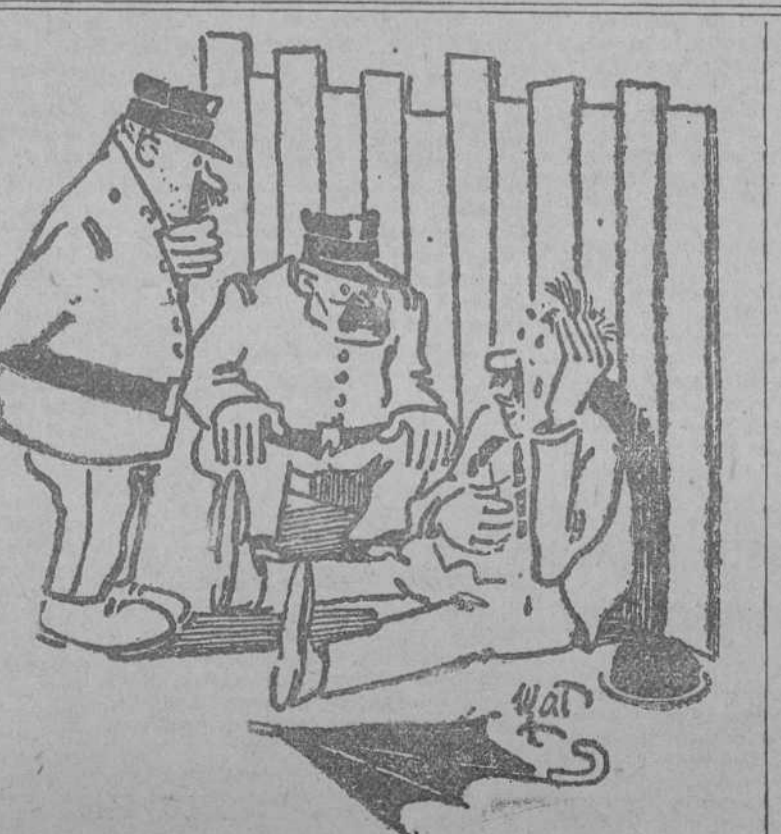
—Es absurdo que lllore usted así por haber encontrado un piso vacío. —Es que es el mío. (Péle Mèle, París.)