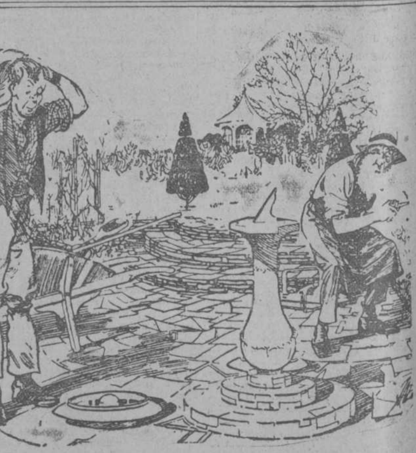
—Oiga usted, jardinero, ¿esto qué es? —Un baño de pájaros. —¡Atiz! ¿Y cómo saben los pájaros cuándo es el baño por la tarde? (Weekly Telegraph, Sheffield.)