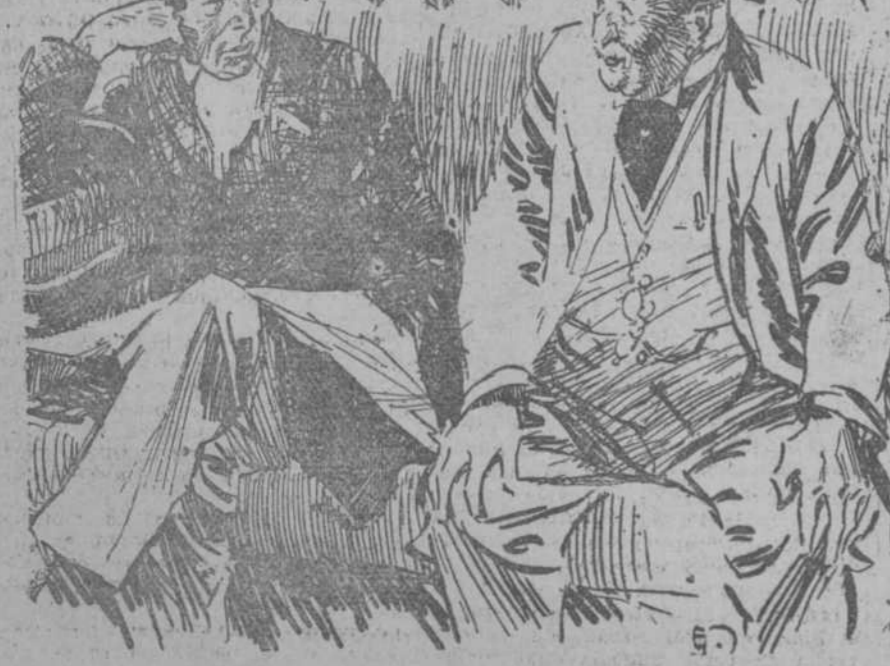
—¿De modo que usted es actor? Yo creo que hace más de diez años que no voy al teatro. Soy banquero, y no tengo un momento libre. —Pues yo estoy seguro que hace lo menos cuarenta años que no voy a una casa de banca. (Passing Show, Londres.)