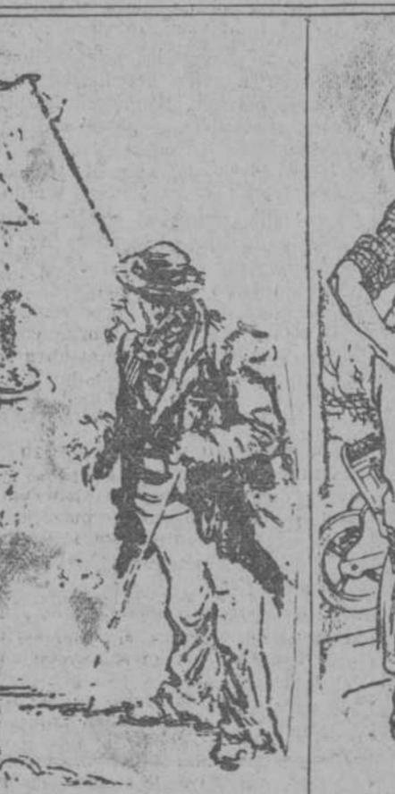
—Tenga usted, hermano, unos pastillitos hechos en casa. —Sí, sí; los comeré. Estoy verdaderamente desesperado. (Passing Show, Londres.)