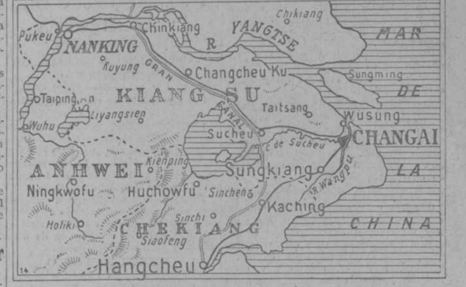
Map showing the location of Changai and other cities in China.