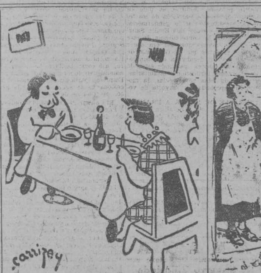
—¿Y usted, admirado pintor, guiso con aceite? —No, señora; a la acuarela. (Pele Mele, París.)