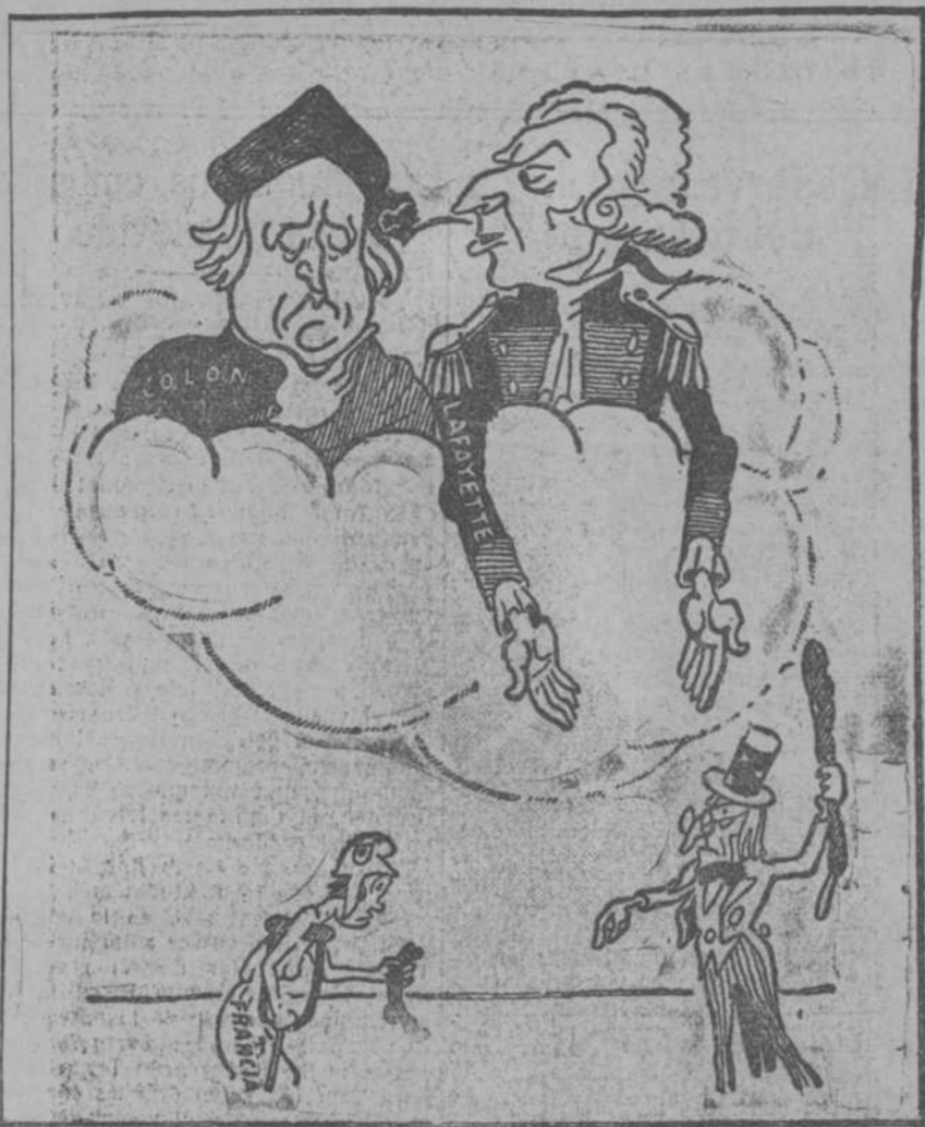
LAFAYETTE.—Buena la hizo usted descubriendo a esa gente! (De Le Petit Provençal, Marsella.)