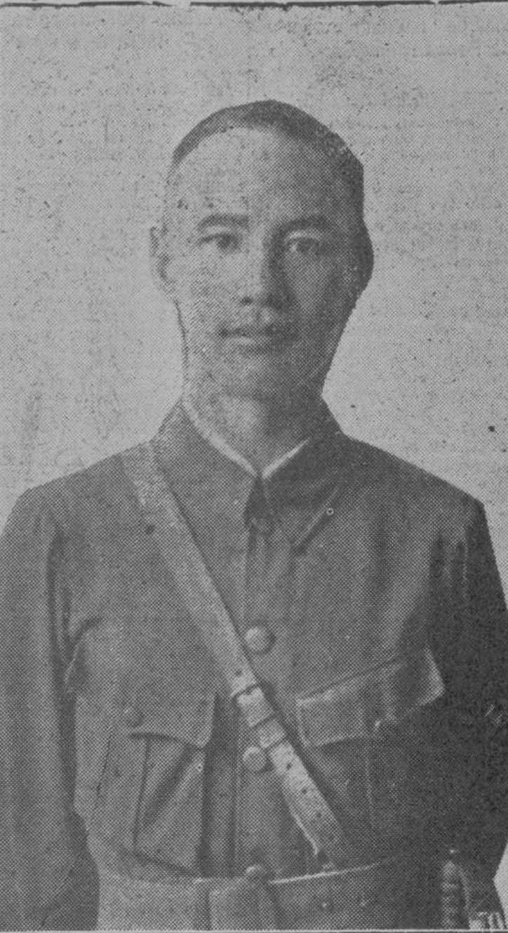
Chang-Kai-Chek, generalísimo del Ejército nacionalista chino

Chang-Kai-Chek, generalísimo del Ejército nacionalista chino El jefe de la insurrección cantonesa no es un hombre lanzado hacia arriba desde las capas populares, en la explosión revolucionaria. Pertenece a una noble familia china. Desciende de los antiguos Reyes de Cantón. Chang-Kai-Shek no ejerce la dictadura. Es miembro del Consejo Ejecutivo, o Gobierno de Cantón. Su jefatura es puramente militar.