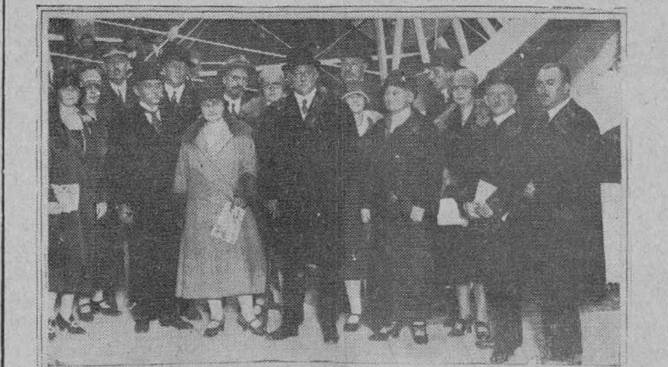
El presidente del Gobierno, con los embajadores de Francia y Bélgica, el ministro de Noruega y las familias de éstos, presidente del Aero Club y coronel Kindelán, visitando las instalaciones en el último día de la Exposición.