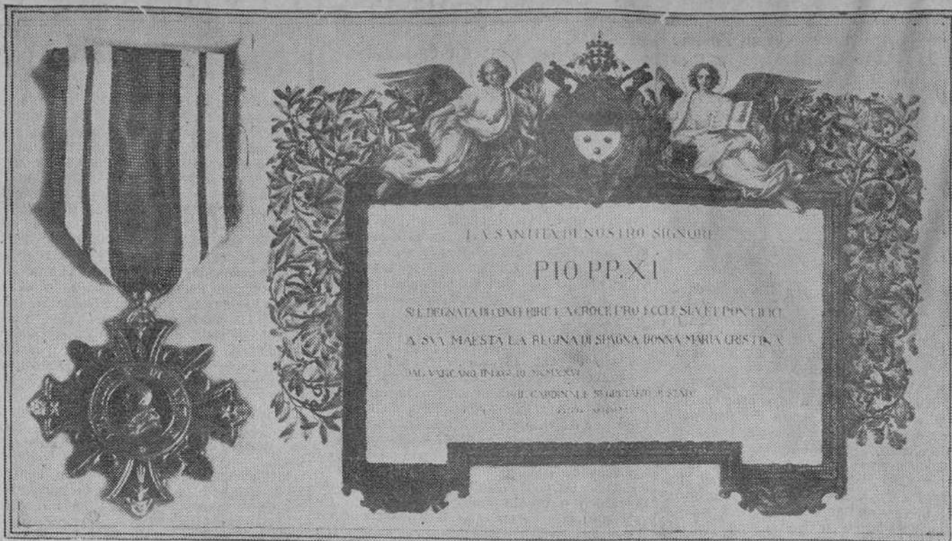
Medalla y diploma de la condecoración pontificia «Pro Ecclesia et Pontifice», que Su Santidad Pío XI ha concedido a la reina Cristina, y cuya entrega le ha sido hecha ayer por el Nuncio, monseñor Tedeschi.