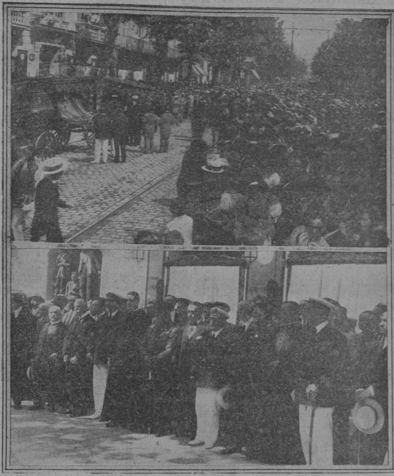
Arriba: La muchedumbre presenciando el paso de la comitiva fúnebre por la Ronda de San Antonio. Abajo: La presidencia del duelo, en la que figuran todas las autoridades de Barcelona y representantes de la familia del malogrado piloto.