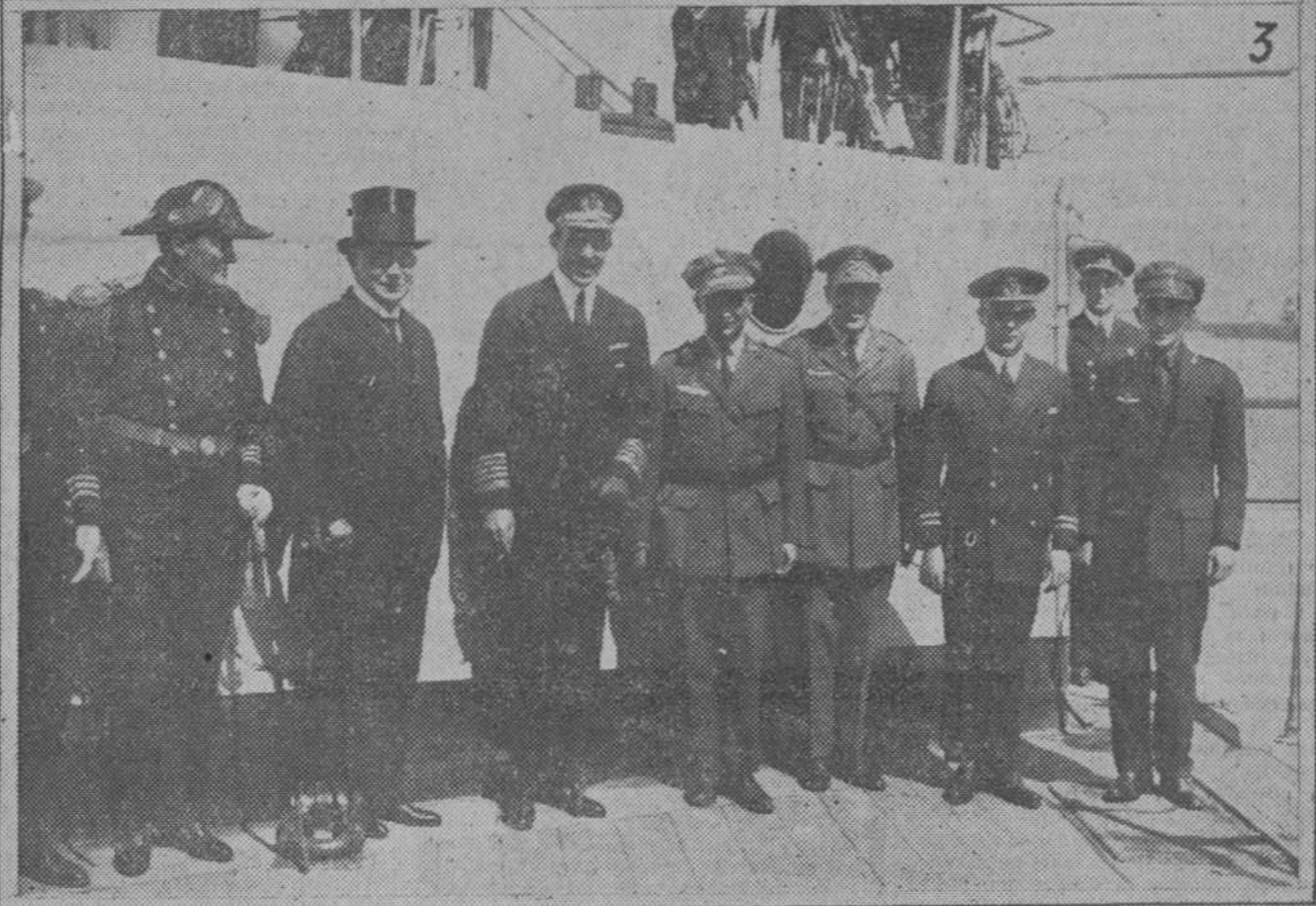
1. Su majestad el Rey pronunciando un discurso en la sesión extraordinaria de la Sociedad Colombina, celebrada en el patio del convento de la Ribada. 2. Entrada del «Buenos Aires» en el puerto de Huelva. 3. A bordo del «Cataluña» (de izquierda a derecha): el comandante del «Buenos Aires», el embajador argentino, su majestad el Rey y los aviadores Fr. Co. Ruiz de Alda, Durán y Rada.