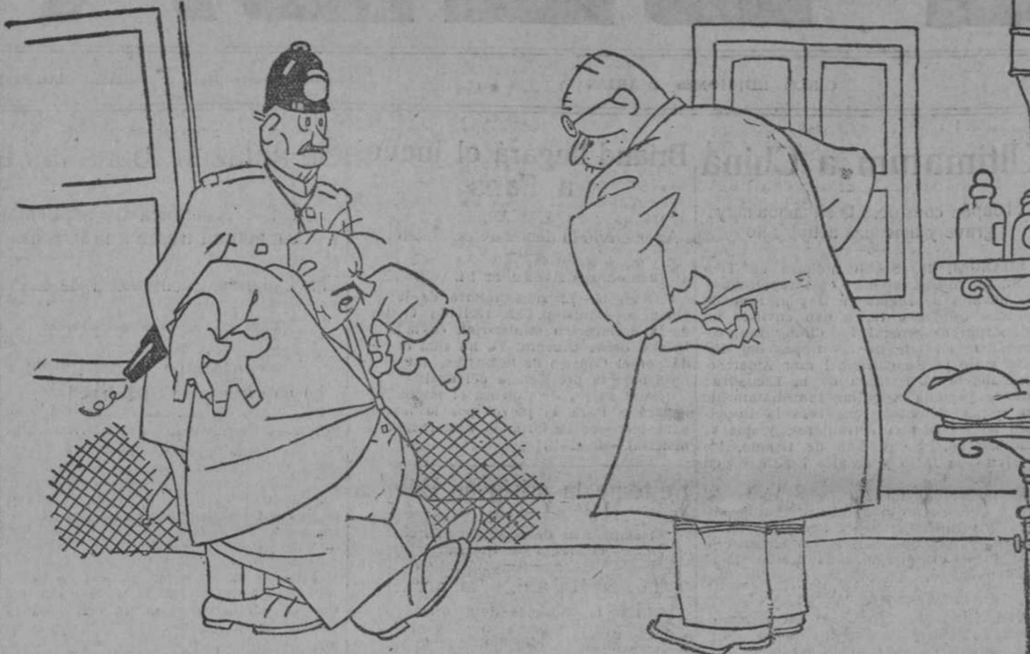
EL ATROPELLADO.—Yo pasé porque vi una luz roja. EL GUARDIA.—¡Y era la de la Casa de Socorro!