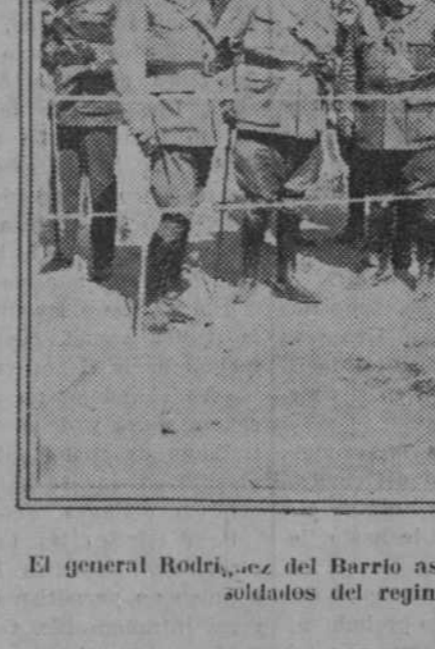
El general Rodríguez del Barrio asiste a la plantación de árboles por los soldados del regimiento de San Marcial.