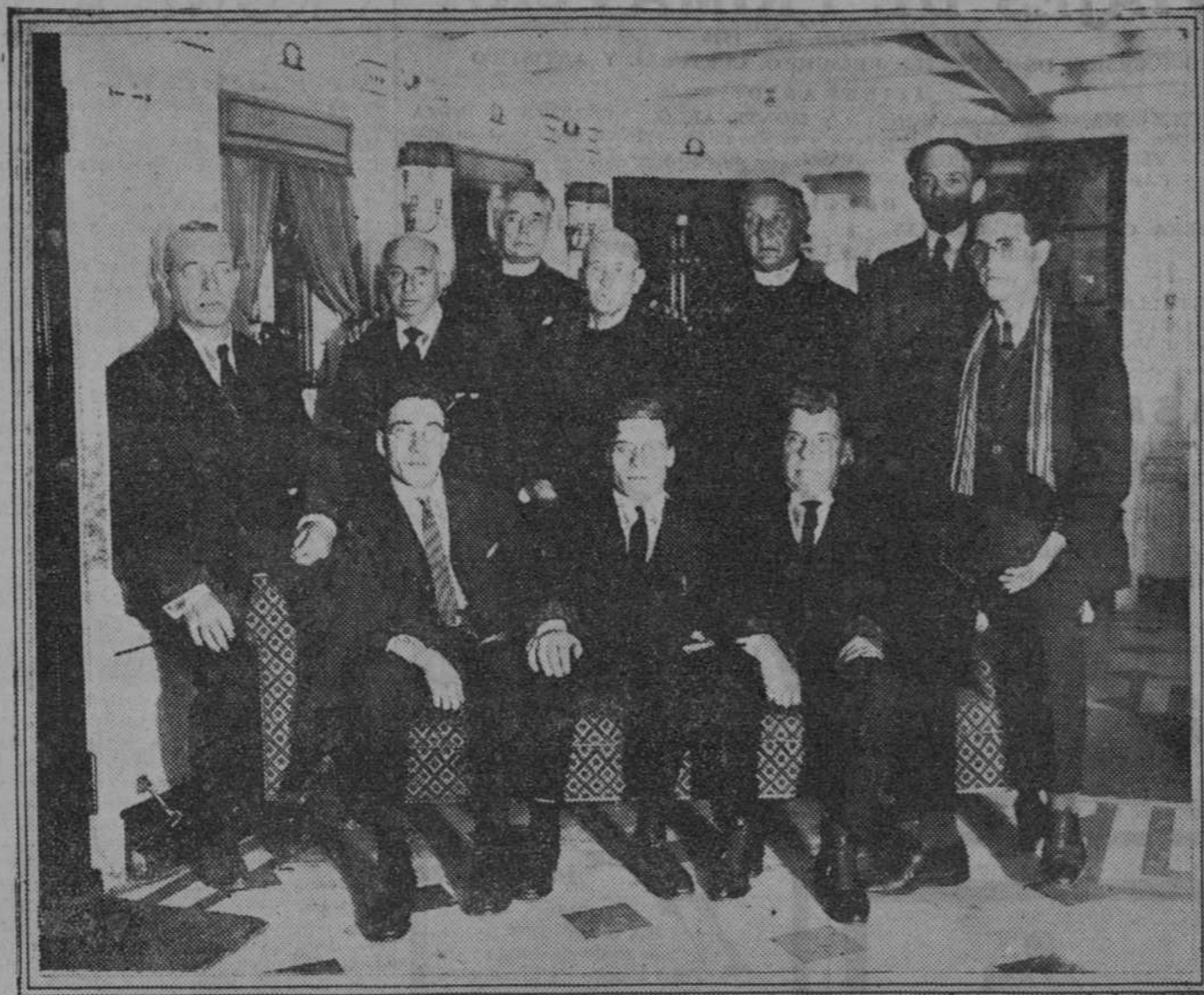
Diez religiosos españoles, expulsados de Méjico, que llegaron a Nueva York a bordo del «León XIII».