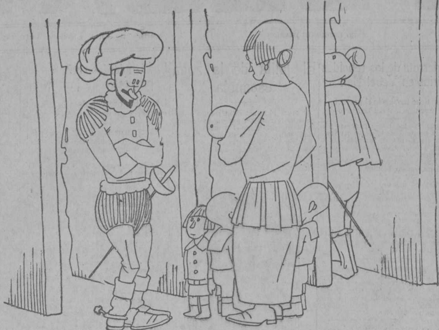
—Oye, Casiano, ¿dónde dejaste el biberón del pequeño, que no lo encontramos por toda la casa?

El monarca. Por eso crece y se extiende la monarquía. Y bastará recordar que, después de la sublevación de las provincias del Norte en 1919, que durante un mes tuvieron una Junta gubernativa, vino el terror de la represión más violenta de la república, lo que no impidió que Lisboas, a pesar de la burla electoral, llevase en 1921 diputados monárquicos al Parlamento.