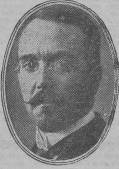
Fidelino de Figueiredo

A las seis y media de ayer tarde dió su anunciada conferencia en el Centro de Estudios Históricos el ilustre profesor portugués don Fidelino de Figueiredo. Asistió (DE NUESTRO REDACTOR ENVIADO ESPECIAL) NUEVA YORK, 3.—La Comisión francesa de las deudas ha embarcado en el paquebote Paris, donde regresará a Francia. APLAZAMIENTO Y NO RUPTURA WASHINGTON, 3.—En la Casa Blanca se declara que el presidente Coolidge no ha añadido nada a las declaraciones oficiales, como no sea que no hay ruptura de negociaciones, sino simplemente un aplazamiento. Los acuerdos americanos han sido tomados por unanimidad, y no hay que creer la afirmación de que se ha llegado a la ruptura, a causa de una indiscreción francesa. El presidente Coolidge lamenta más que nadie que no se haya llegado a un acuerdo; pero confía en que, en el curso de los cinco próximos años, la situación de Francia habrá mejorado de manera que sea posible el arreglo, bajo un punto de vista mutuo, en el que se reconozcan las aspiraciones de Norteamérica.