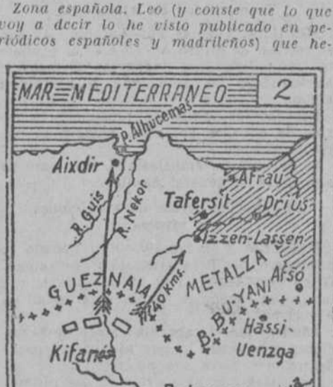
Situación (aproximada) de los Franceses.

Zona española. Leo (y conste que lo que voy a decir lo he visto publicado en periódicos españoles y madrileños) que he-