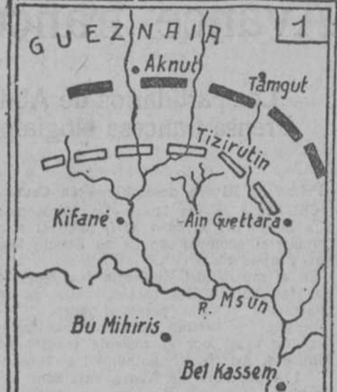
Posición (aproximada) de los Franceses el 30 de Septiembre. Idem el 1º de Octubre.

El órgano socialista dice esta noche que, efectivamente, ha sido dicha así, y bajo la presión de los nacionalistas, el Gobierno del Imperio va a realizar una acción que no puede resolver con principios razonables la política exterior alemana.