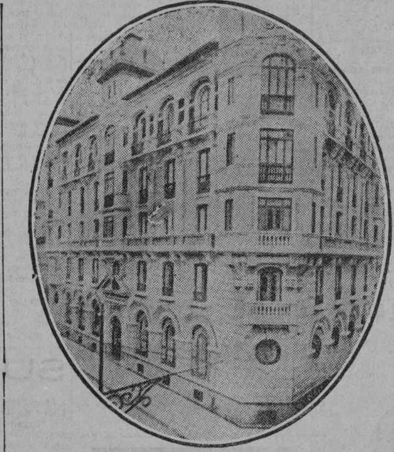
Palacio propiedad de la Federación Católico-Agraria

Se pone especial cuidado y se ejerce una activa vigilancia en la