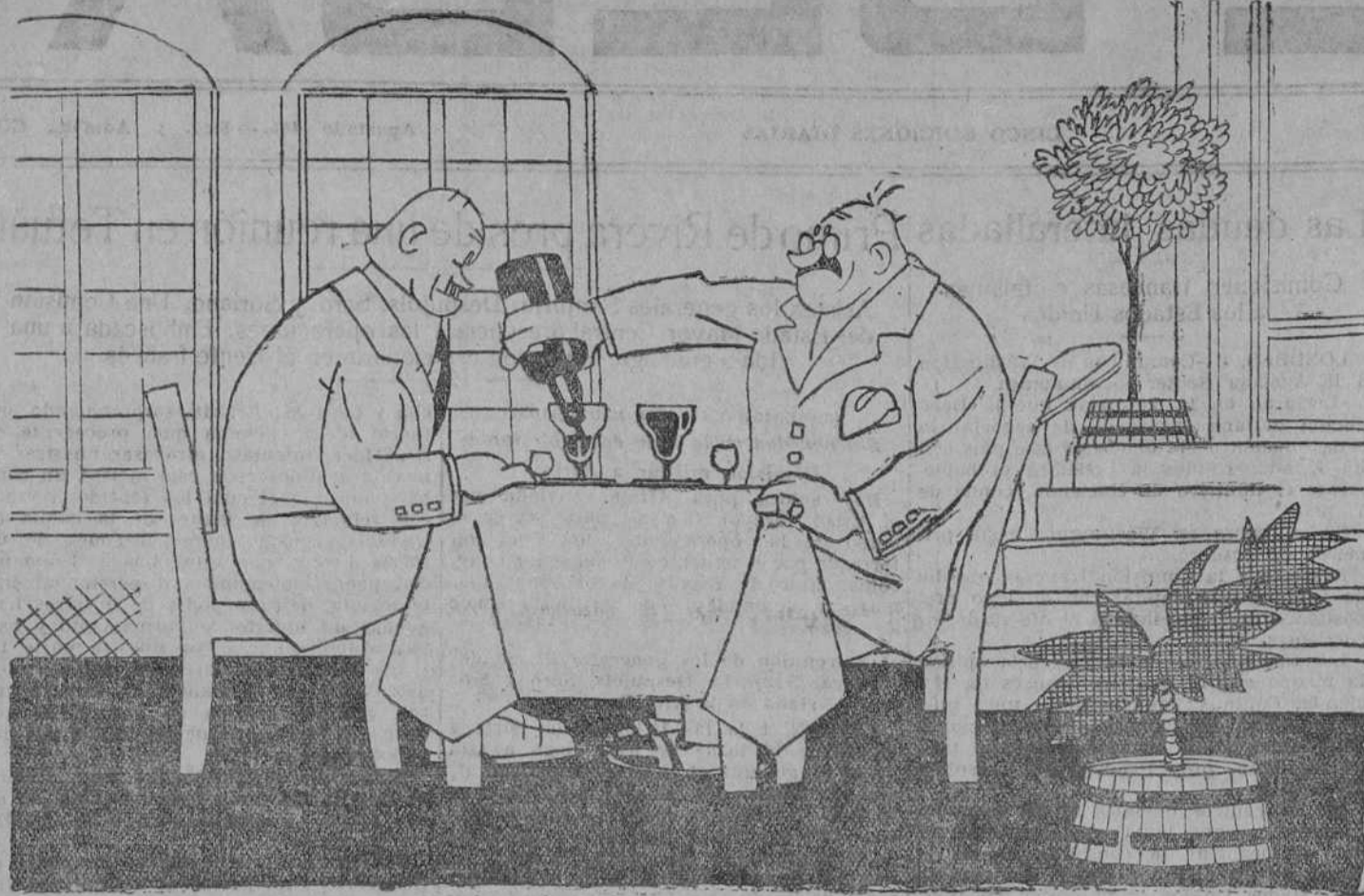
—Pues aquí me tiene usted tomando estas aguas...