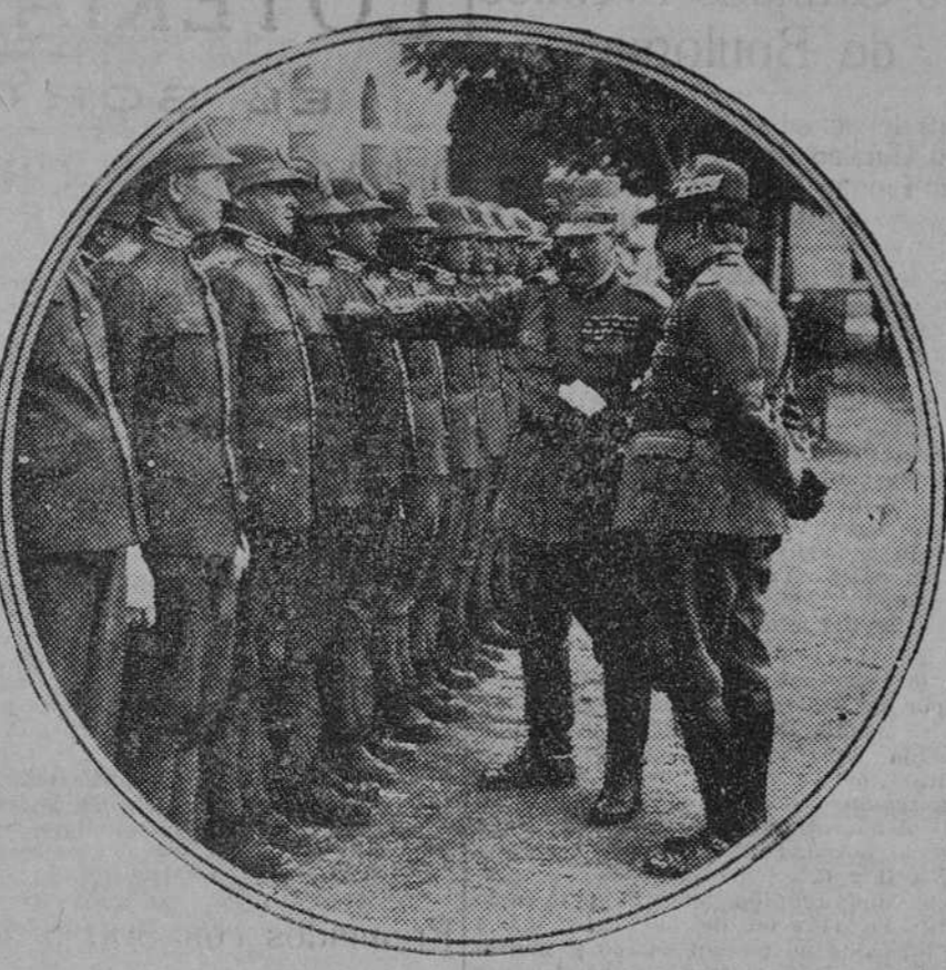
El general Gandolfo, fallecido anteayer durante una reciente revista a la infantería italiana