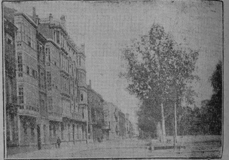
Paseo-salón de Isabel II

El Circulo de la Unión Mercantil e Industrial a los tres años de estar constituido ya tenía amortizados los gastos de instalación, y desde la fecha de su fundación con gran altruismo viene contribuyendo con cantidades de relativa importancia para un gran número de obras benéficas, tales como la Gota de Leche, Asociación de Caridad, el Comedor y Colonia Escolar, la Escuela de la Asociación de Dependientes, en favor de la cual contribuye mensualmente con una cantidad para el sostenimiento de las clases nocturnas, y otras elevadas cuotas para diversas Asociaciones benéficas de viajeros y dependientes.