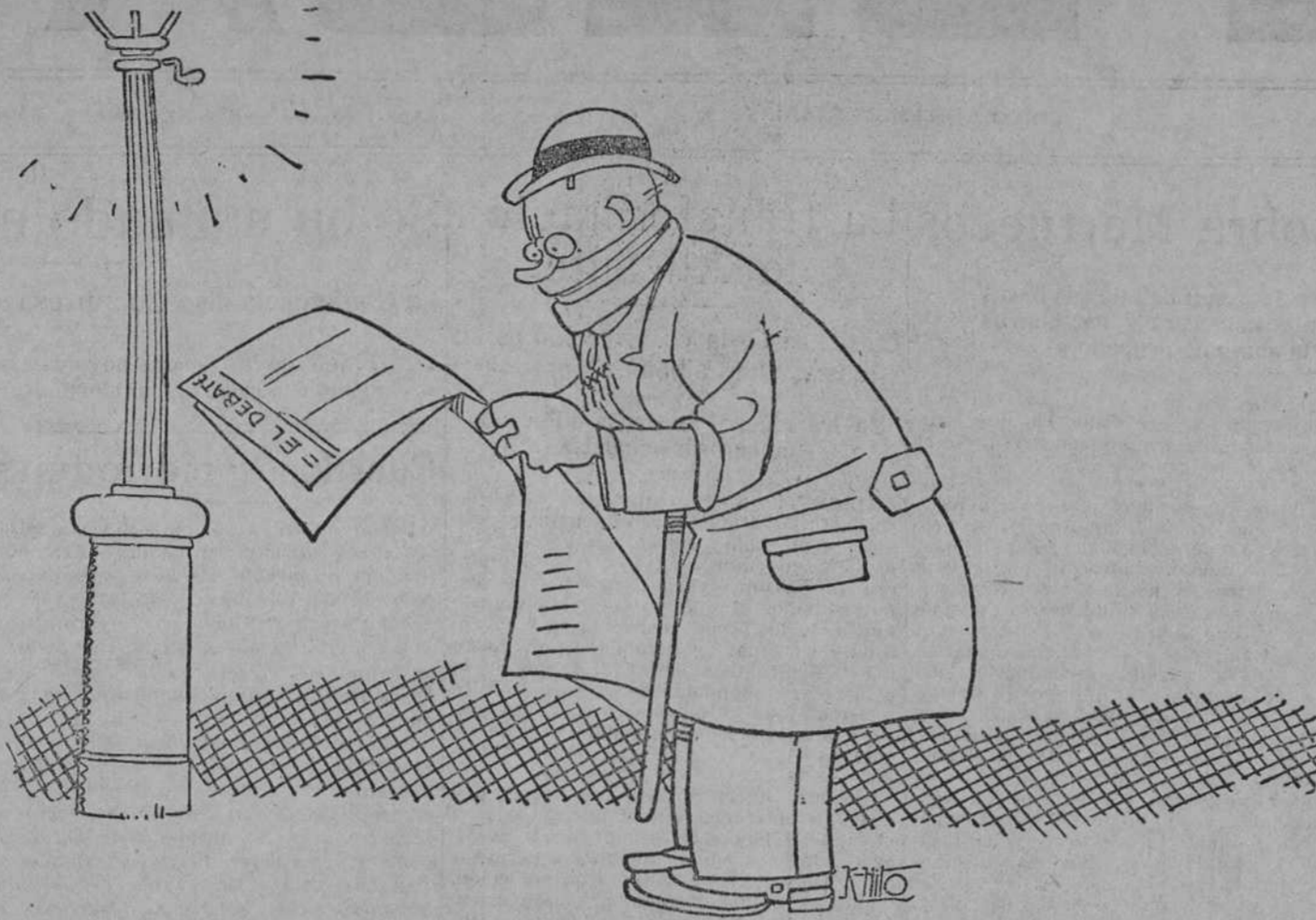
(Leyendo.) «Han salido: para el Ecuador, don...; para la Habana, don...»