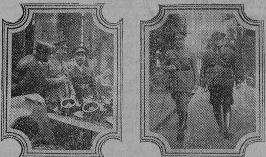
El capitán general de la octava región, don Dámaso Berenguer, visitando la fábrica de cañones de Trubia. En la fotografía de la derecha aparecen el general Berenguer y el coronel Pérez Vidal, director de la fábrica.