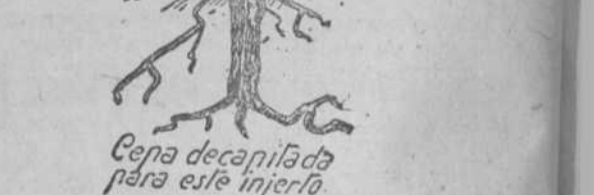
Cepa decapitada para este injerto

La aplicación del injerto ordinario de primera, decapitando la cepa para injertarla hon-