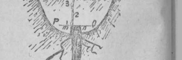
Injerto hecho y la cepa aportada

Regeneración por el injerto ordinario de púa