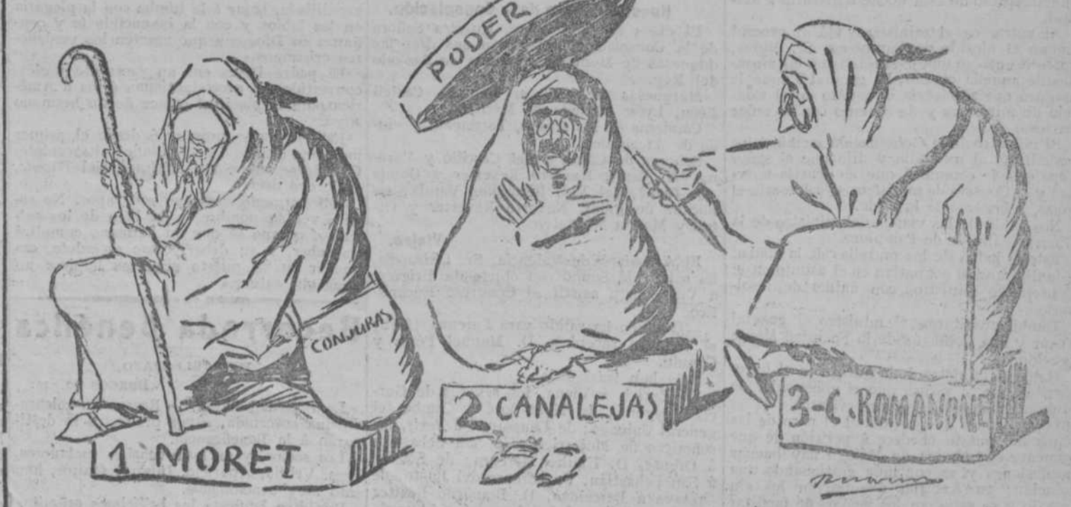
Muley "Iba" para jefa... Muley "Josef" ó "Pepef" como el de Marruecos. Muley "Va" para jefe, en cuanto queda colarso.