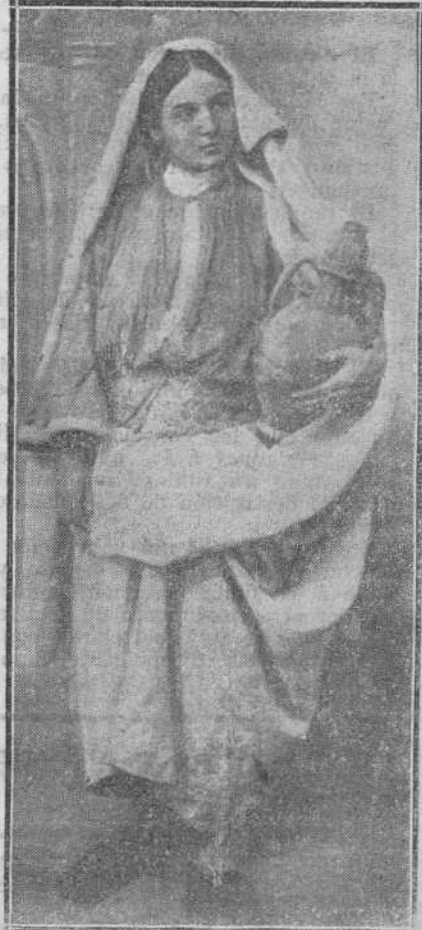
TÁNGER.—Tipo del país.

El cial Sr. Lerroux presentose ayer en el Congreso con un sombrero de espa de