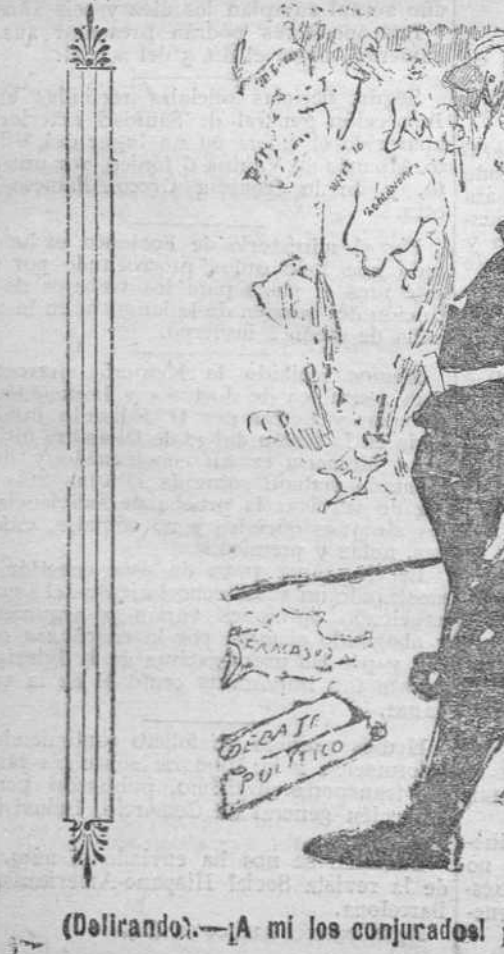
(Delirando).—¡A mí los conjurados! ¡Ay de mí zancadas de la Gasconía!