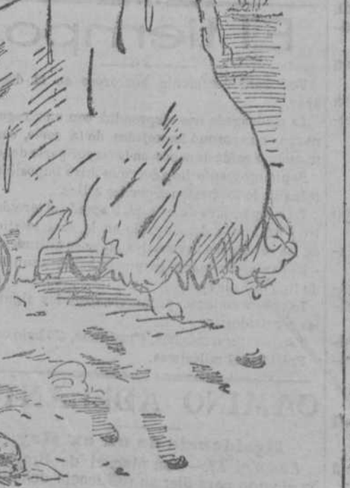
Campeamento de Alfonso XIII 9 Enero 1911.