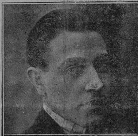
Enrique Rambal, popularísimo actor y director de la compañía que actúa con gran éxito en el Gran Metropolitano de esta corte

Todos los días alcanza Rambal un éxito clamoroso con la reposición de «Miguel Strogoff o el correo secreto del zar», modificada y reformada. Una presentación verdaderamente fastuosa y una interpretación irreprochable hacen de «Miguel Strogoff o el correo secreto del zar», el éxito espectacular del día.