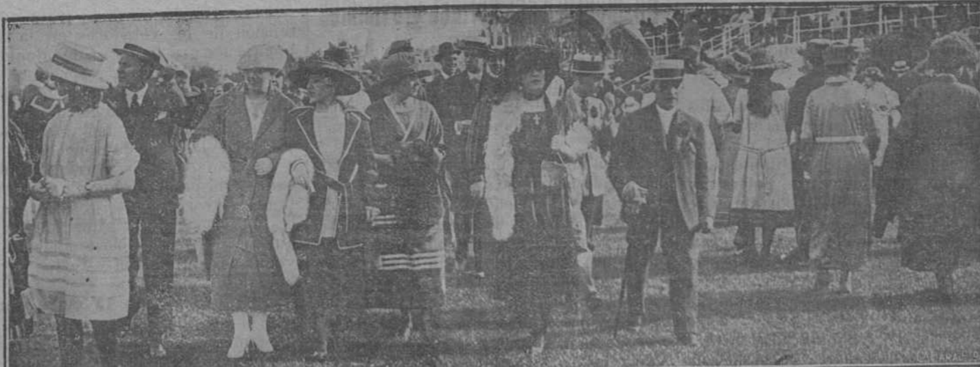
Un aspecto del Hipódromo durante las carreras verificadas ayer

Ahora sólo nos resta dar la más cordial enhorabuena a los organizadores de la fiesta y a las encantadoras y deliciosas señoritas que prestaron a ella su concurso.