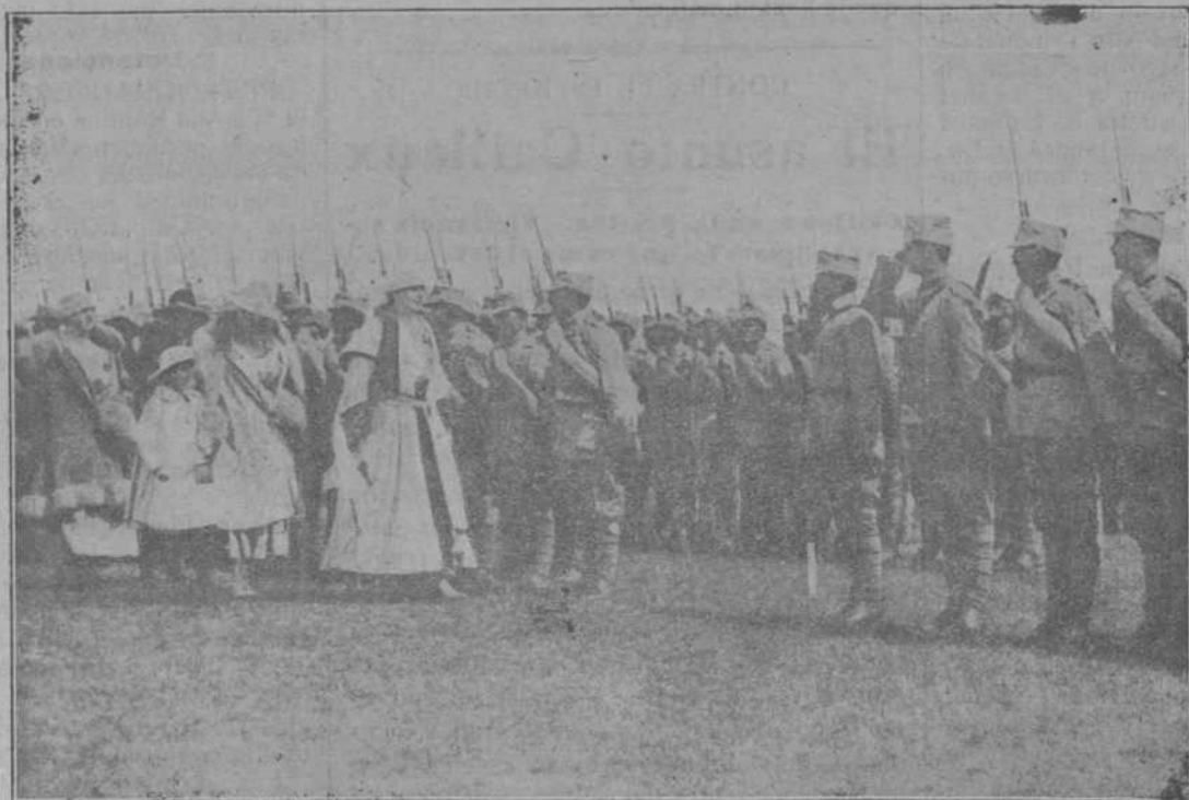
La hermosa reina de Rumania, acompañada de sus hijos, visita algunos regimientos acampados en las cercanías de Sassy

Fueron capturados algunos prisioneros al Oeste de Osteria il Lepre durante un golpe de mano.