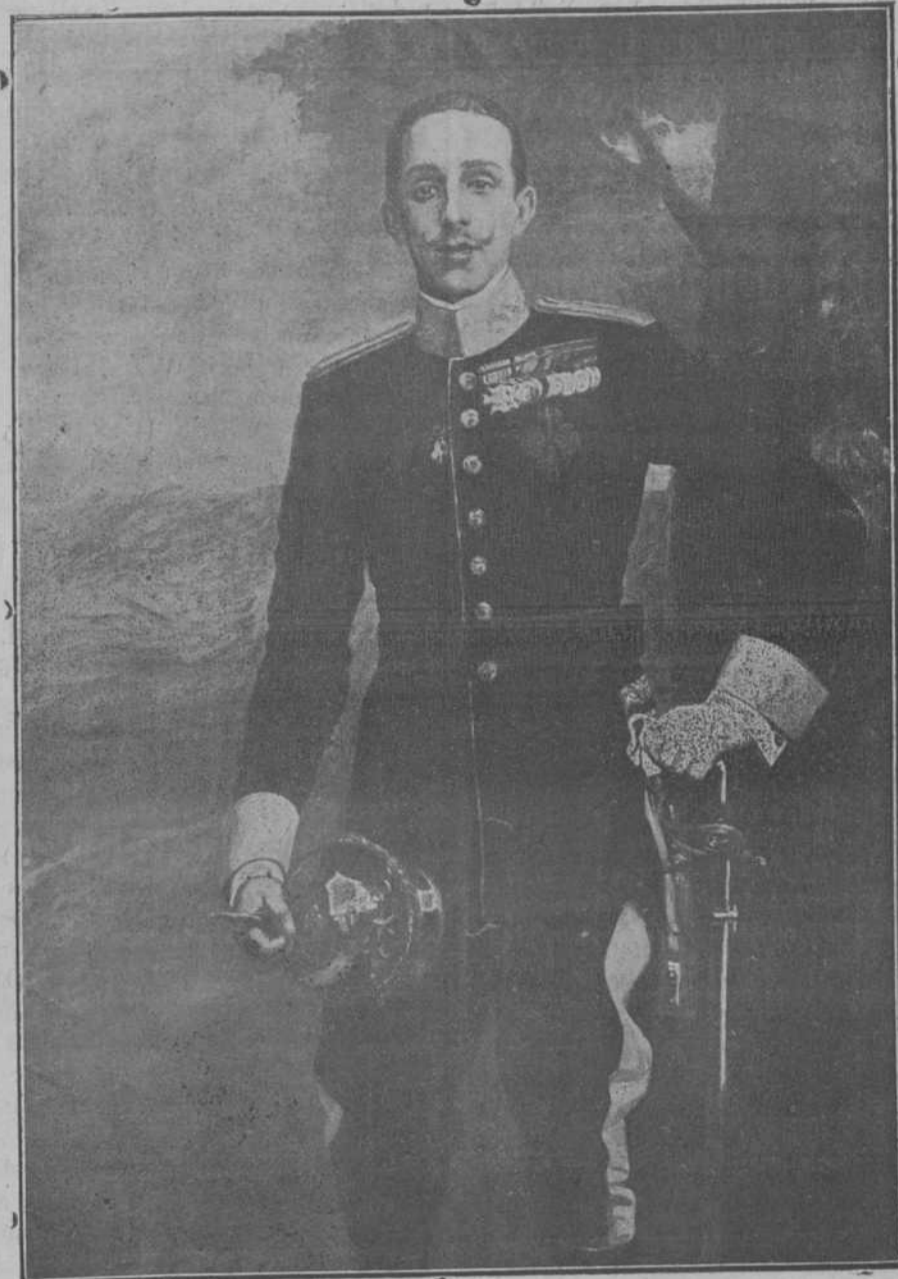
Ultimo retrato de S. M. el Rey Don Alfonso XIII