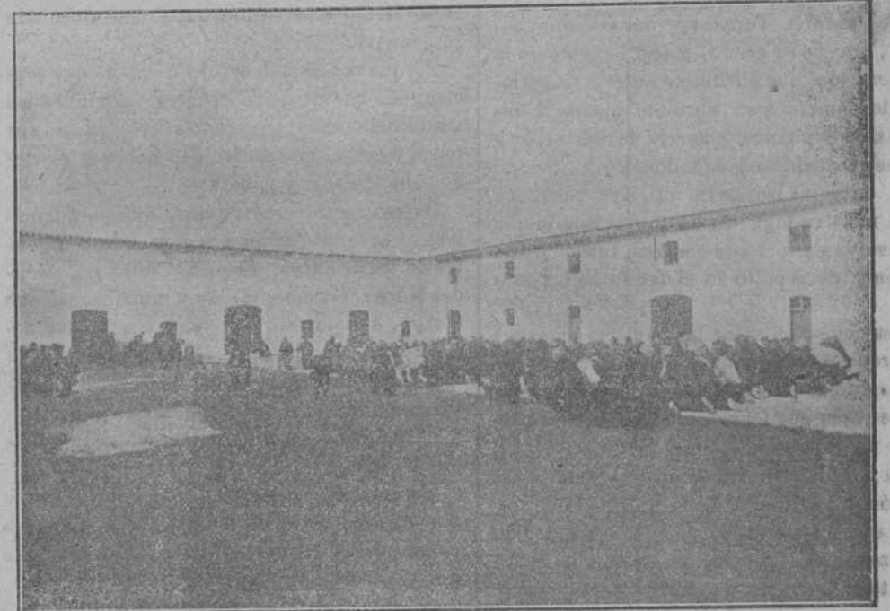
Prisión de Estado de San Fernando.—Segundo patio: Momento de elevar la Sagrada Formá en la primera misa.

El desdén con que en nuestro país, como dice muy bien el autor, se miran las cuestiones penitenciarias, por el clásico recelo que la Justicia, en sus precisos complementos, inspira, hace que los pueblos rechacen, por atávico espíritu, la creación en su zona de colonias penitenciarias. Esto explica que Valladolid, Zaragoza y Mallorca se hayan sacudido lo que juzgaban pesada carga, y que