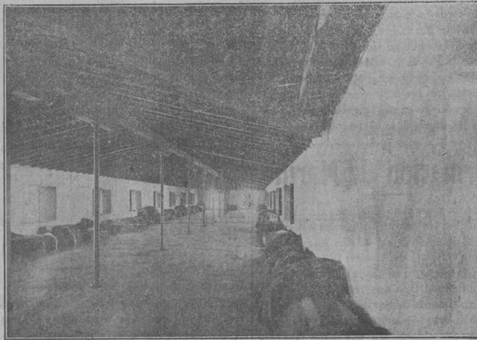
Prisión de Estado de San Fernando.—Dormitorios con vistas al mar.

nos encontremos, al desaparecer los presidios de Africa, con 15.000 penados insalubre y antihigiénicamente repartidos en Burgos, Granada, Santaña y Chinchilla.