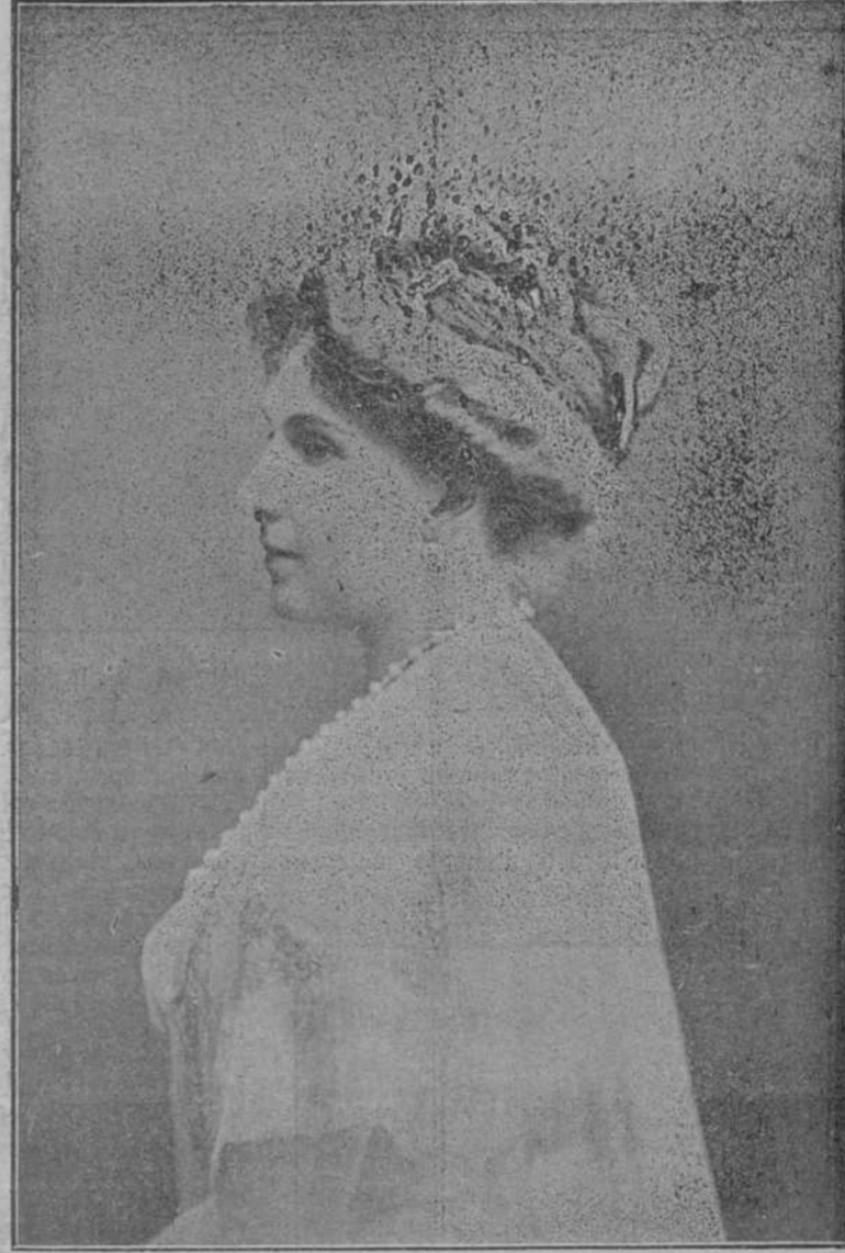
S. M. la Reina Victoria, madrina del lanzamiento.

Sería una obra verdaderamente patriótica la de hacer públicos los esfuerzos y sacrificios que nuestros marinos de guerra tienen que realizar de continuo para llevar a cabo cualquier servicio propio de su Instituto, como es ahora el muy penoso de la campaña del Rif, con un material que en su casi totalidad es anticuado y deficiente; porque si la opinión pública se percatara de ello, es seguro que no se mostraría indiferente, y antes bien, pediría que se dotara a nuestra Marina de los medios y recursos necesarios para su más pronta reconstitución, pensando además que una flota potente, dentro de nuestros modestos recursos, destinada, no a empresas guerreras, impropias de nuestra situación, sino a llevar por todos los mares el glorioso pabellón de España y a estrechar nuestras relaciones con las demás potencias marítimas, y sobre todo con las que fueron un tiempo posesiones nuestras, puede contribuir poderosa y eficazmente al engrandecimiento y a la prosperidad de la Patria española.