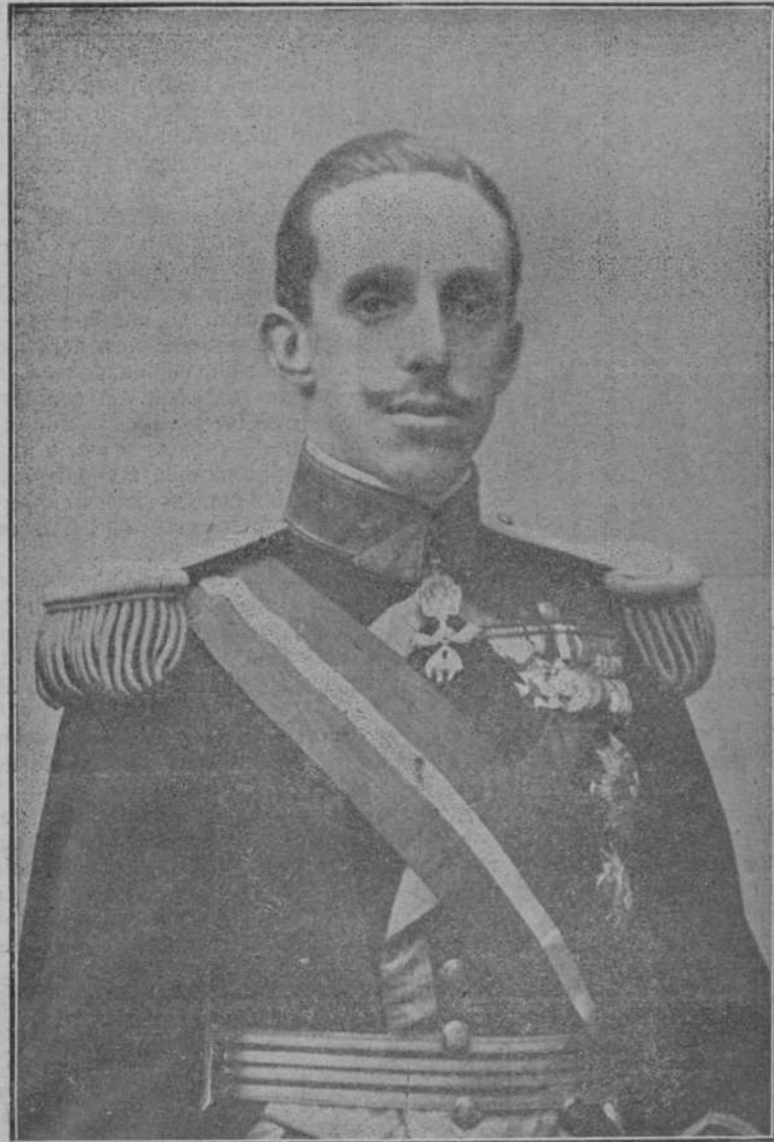
S. M. el Rey de España, capitán general de la Armada.