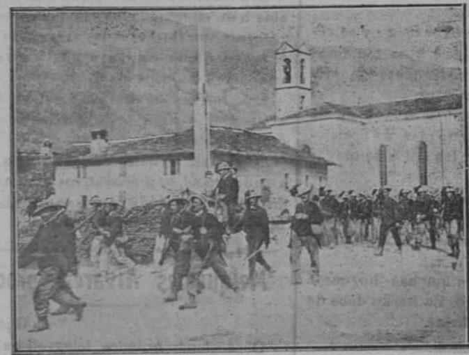
BERSAGLIERIS ITALIANOS EN MARCHA

Base tercera.—El segundo período de la instrucción se dividirá en dos cursos de un año cada uno: el primero, de estudios de preparación, y el segundo, de aplicación. En el primero se estudiarán ciencias físicas y matemáticas, cuyos programas se estudiarán partiendo de los conocimientos anteriormente adquiridos y se les dará la extensión y alcance absolutamente preciso para el objeto que