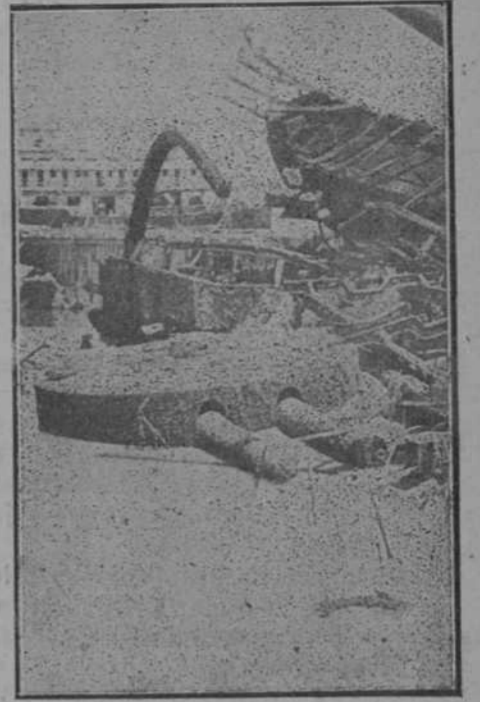
Después de una inmersión de trece años. La torre posterior con sus cañones intactos.

En el libro y sobre el plano, manejando hombres y dinero á placer, trazando líneas precisas, ajustadas al rigor geográfico, no perdiendo de vista ni los in-