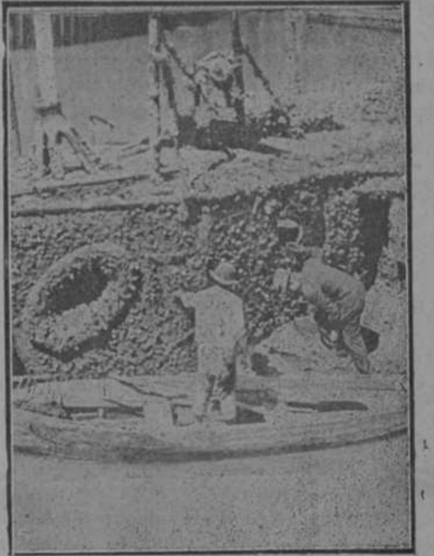
El mayor ferguson examinando los restos para descubrir la causa de la explosión.

significantes pleachos ni los arroyuelos sedientos, se podrá hacer un trabajo magnífico, tan magnífico como irrealizable. Esto es, después de todo, lo fácil.