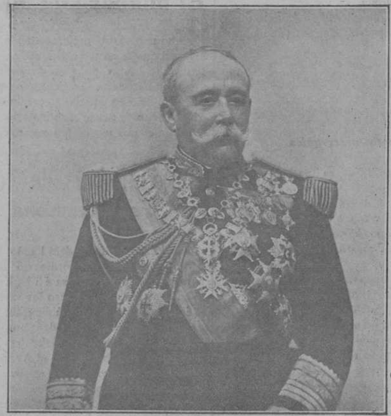
El Excmo. Sr. D. Camilo García de Polavieja, Marqués de Polavieja.

Primitivamente el globo Torres no llevaba empennage ó cola propiamente dicha; pero se le ha añadido después una cola cilíndrica trilobulada, inflada por el gas, lo mismo que