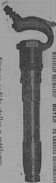
Sírvase pedir catálogos y catálogos.

Indispensable para Talleres mecánicos, Astilleros, Diques, etc.