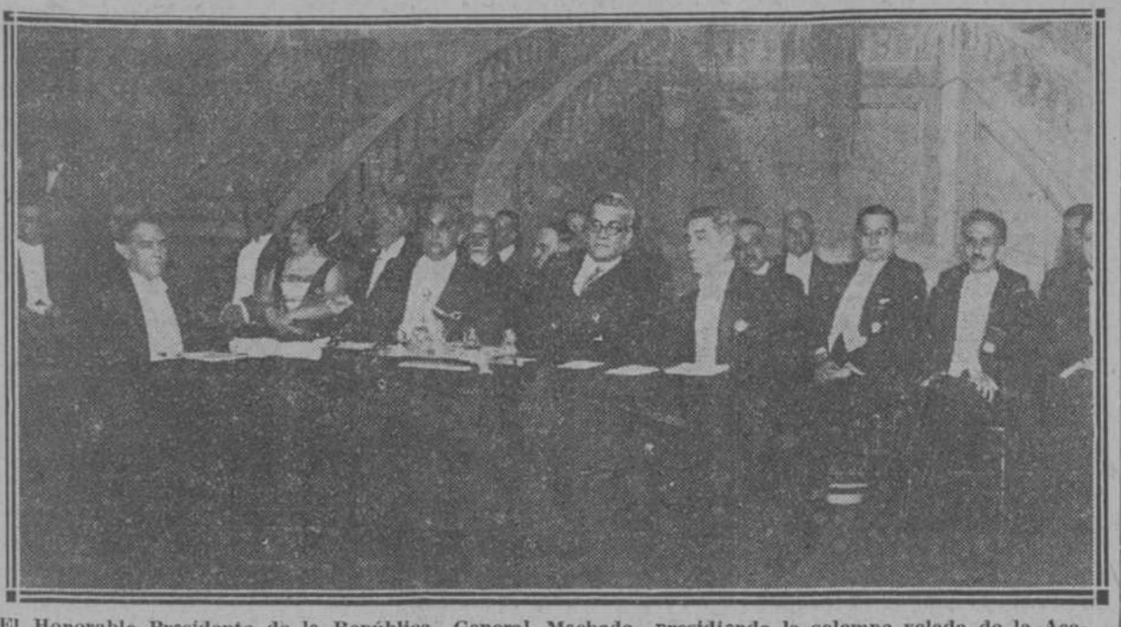
El Honorable Presidente de la República, General Machado, presidiendo la solemne velada de la Academia de Artes y Letras, celebrada ayer en el Teatro Nacional.

Ayer se celebró en el Teatro Nacional la sesión solemne de la Academia de Artes y Letras para inaugurar los trabajos del curso académico y honrar la memoria del ilustre academigo Manuel Sanguliy.