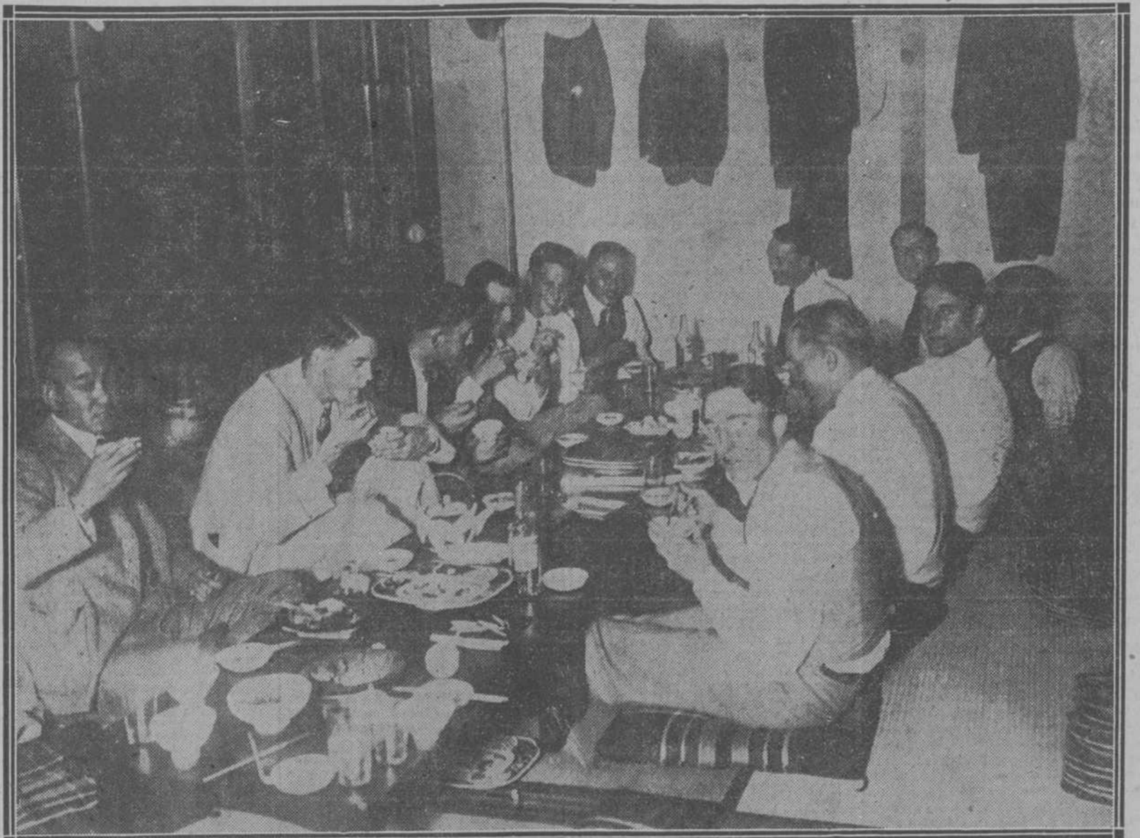
En esta foto aparecen en Tokyo, comiendo en estilo puro japonés, los muchachos estudiantes de la Universidad de Chicago que forman un excelente team de base ball y que han estado visitando las principales ciudades del Imperio del Sol Naciente. Toda su campaña la han hecho jugando con los mejores teams de los colegios japoneses. Los Caribes del doctor Inchán hicieron hace días algo parecido; se fueron a comer a una fonda de chinos de la calle de Consulado para celebrar el triunfo sobre el Loma Egnis en el último match que celebraron