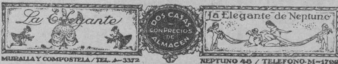
MURALLA Y COMPOSTELA / TEL. A-3372 NEPTUNO 48 / TELEFONO M-1799