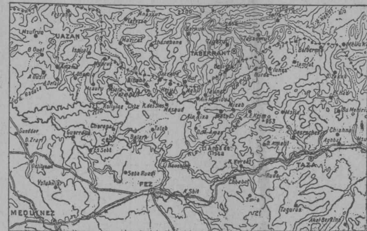
Mapa de la zona de protectorado de Francia en Marruecos, en que los Rifinos de Abd-el-Krim han atacado a las tropas francesas. Al Nordeste se ve Uazan, al Suroeste, Tazza, en donde la lucha ha sido importante. Fez, la Capital de ese Protectorado, se ve al Sur y centro del Mapa.

Estas artistas debieran contestarle con mucho respeto a esa autoridad, pero al través de un buen abogado. Para preguntarle a su vez ¿en qué artículo de la Constitución ha basado él estos escritos que tanto han hecho llorar en estos días a muchos ojos de mujer!