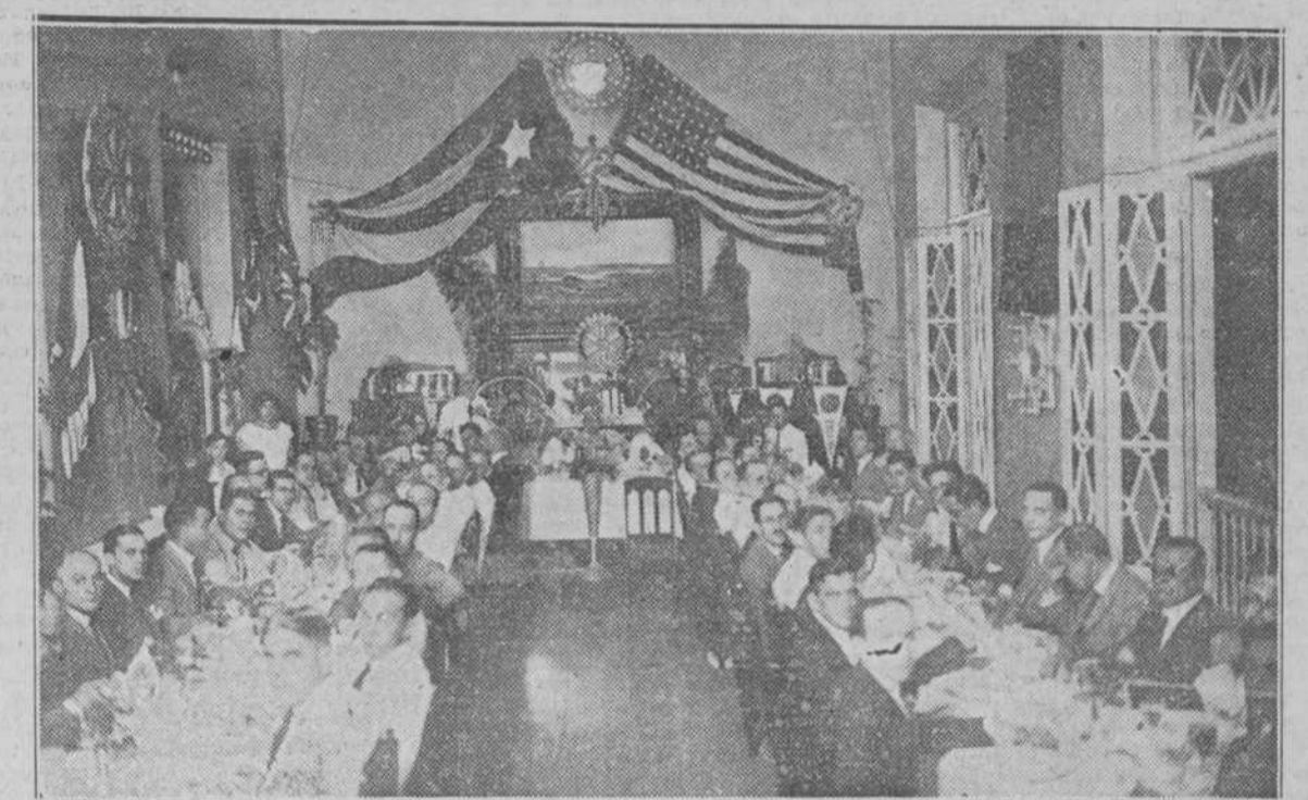
Aspecto del comedor del "Louvre" durante la sesión rotaria celebrada el 14 de Julio, séptimo aniversario de la fundación Club Rotario de Matanzas.

CON MOTIVO DE SU SEPTIMO ANO DE EXISTENCIA, EL CLUB ROTARIO CELEBRA UNA IMPORTANTISIMA SESION COMIDA EN EL HOTEL "LOUVRE"