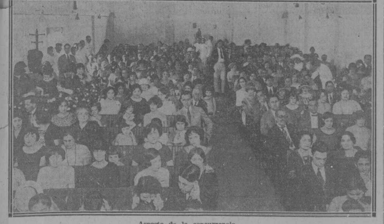
Aspecto de la concurrencia