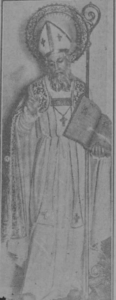
Isidoro, Patrón de la ciudad de San Juan de la Asociación Católica de hombres que lleva ese santo nombre

bién tomarán la santa comunión los miembros de los potentes capítulos San Rafael número 1 y San Antonio número 2; los aspirantes a Caballeros de San Isidoro, los Caballeros de Colón, las alumnas del Colegio el Sagrado Corazón de Jesús y las damas y damitas que pertenecen a las asociaciones Hijas de María, la Caridad y el Apostolado.