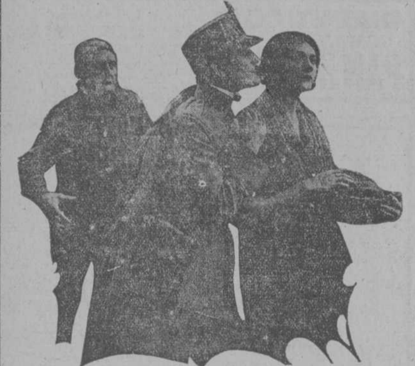
WILLIAM V. MONG, WALLACE MAC DONALD AND BARBARA LA MARR IN "THY NAME IS WOMAN"