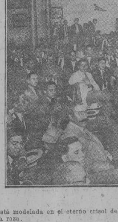
Concurrentes a la Asamblea

El tiempo le confirmó los arrullos de sirena con que pretendía, como se dice vulgarmente, tomarle el pelo, y vio como salían a la palestra los diferentes grupos. Consultado sobre la Candidatura de Cuesta, le