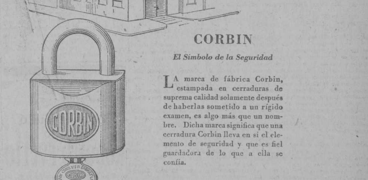
CORBIN El Símbolo de la Seguridad