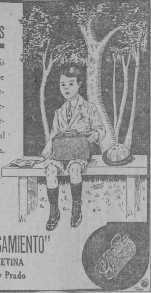
"EL PENSAMIENTO" C. B. ZETINA Monte y Prado

Pidan a sus papás que les compre una bonita maleta, maletín o portafolio para llevar sus libros al colegio o escuela.