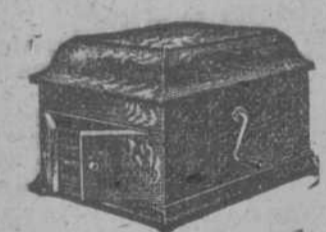
Victrolas XIII y IX Precios: $70.00 y $90.00