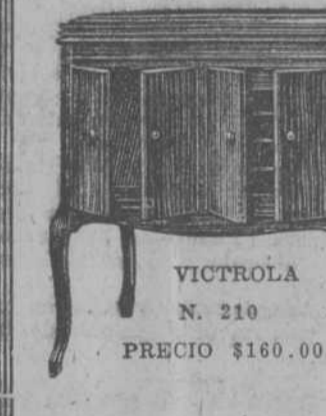
VICTROLA N. 210 PRECIO $160.00