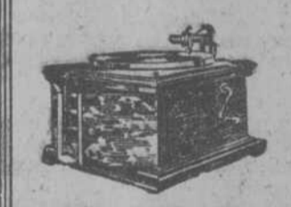
Victrola IV y VI $30.00 y $42.50