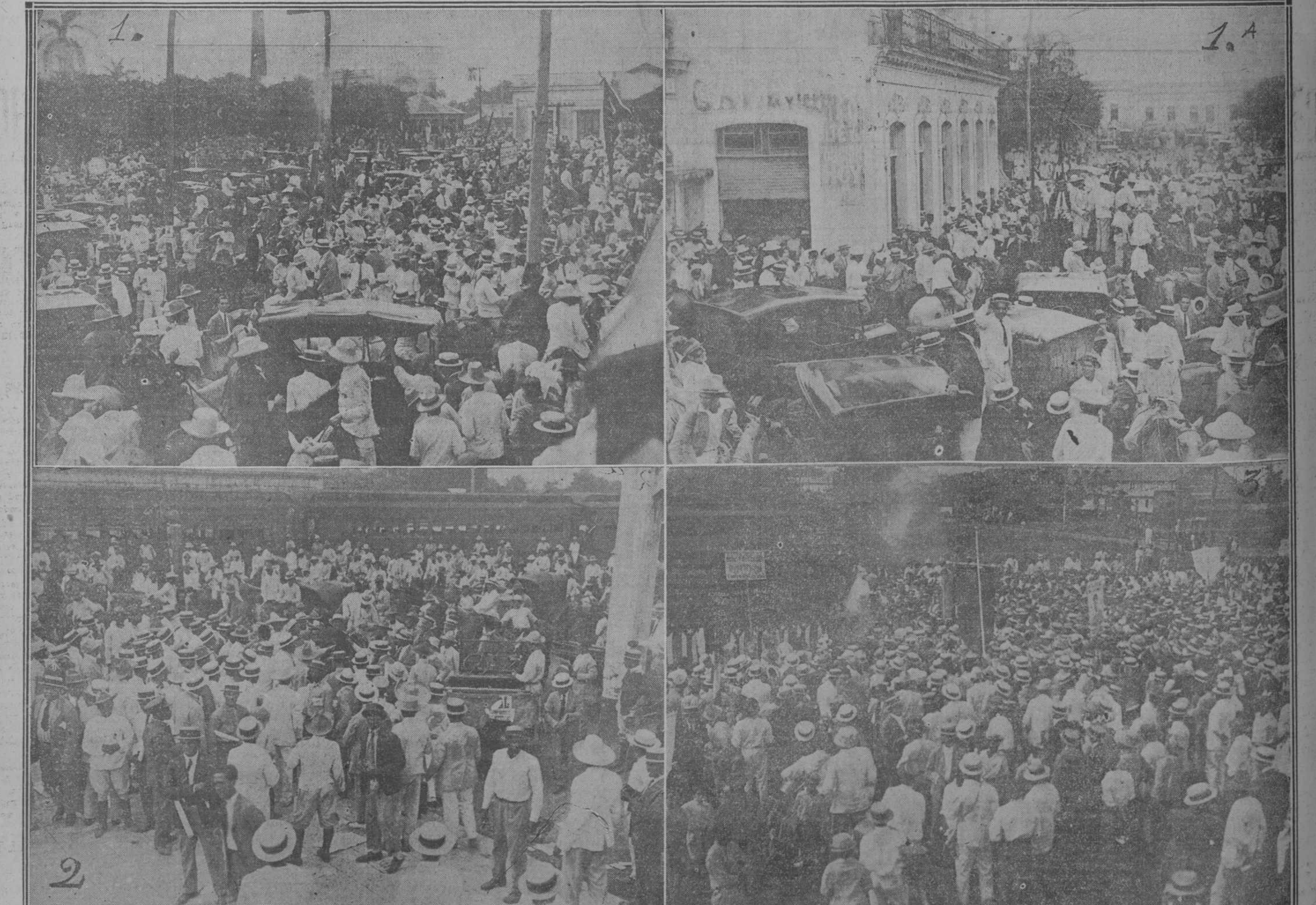
Números 1 y 1 (a): El público esperando el tren excursionista en Santa Clara.—Número 2: Llegada a Santo Domingo—Número 3: Llegada a Jovellanos.