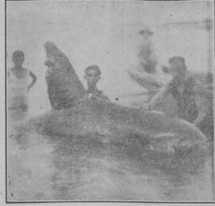
FUE HERIDO A BALAZOS