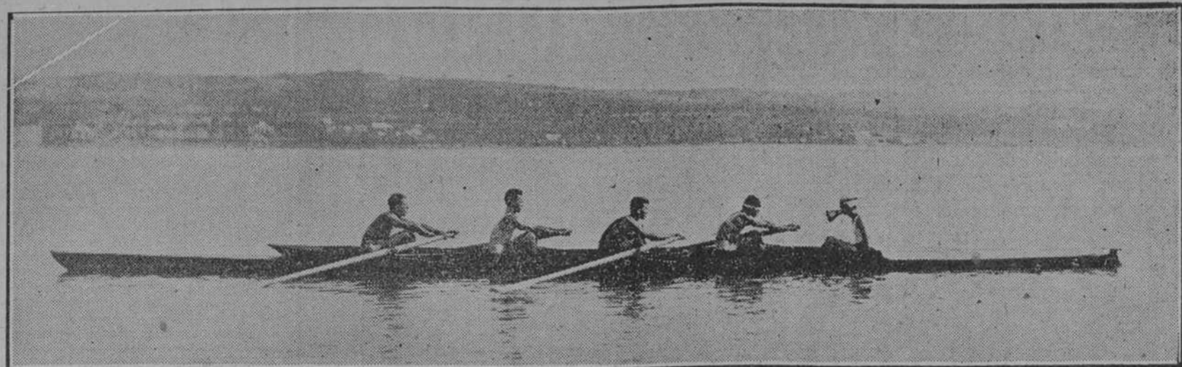
HACIENDO PRÁCTICAS LA CANOA DEL LICEO EN LA BAHIA DE MATANZAS