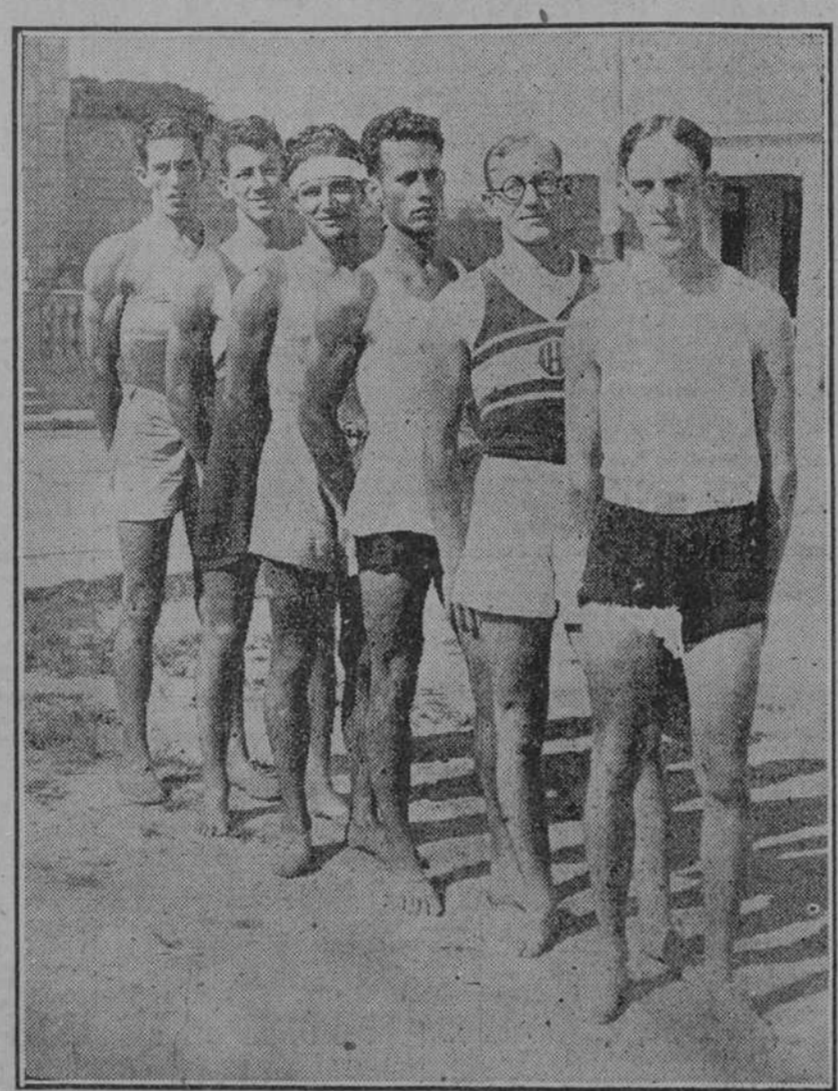
TRIPULACION DEL LICEO DE MATANZAS