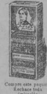
Compre este paquete Rechace toda imitación.