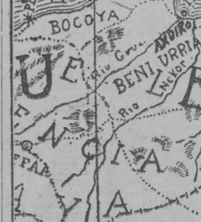
En este mapa se ve la bahía de Alhucemas y en ella la Isla, fortificada. En el hinterland se halla el poblado de Axdir...

El pueblo de Alhucemas, que se efectuó el viernes, a las diez y treinta de la mañana.